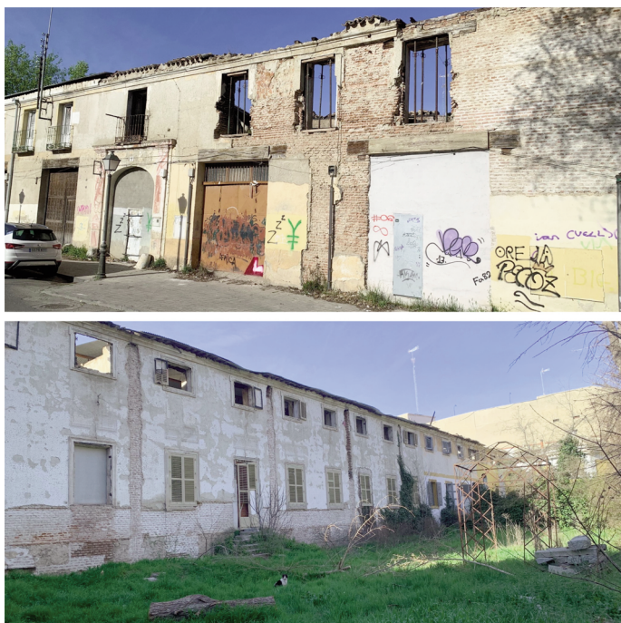
Fig. 1. Estado actual del Palacio de los duques de Osuna.

Originariamente, el edificio deriva de un palacete construido en Aranjuez y terminado en 1750 por el italiano, y tracista del urbanismo de Aranjuez, 4 Giacomo Bonavía para el cantante Farinelli. 5 Más tarde fue adquirido por Carlos III y a este por los duques de Osuna el 14 de diciembre de 1787. 6 Del matrimonio de los duques de Osuna, sin duda, destacó María Josefa Alonso-Pimentel, condesa y duquesa de Benavente y una figura eminente en el entorno ilustrado de Carlos III. 7