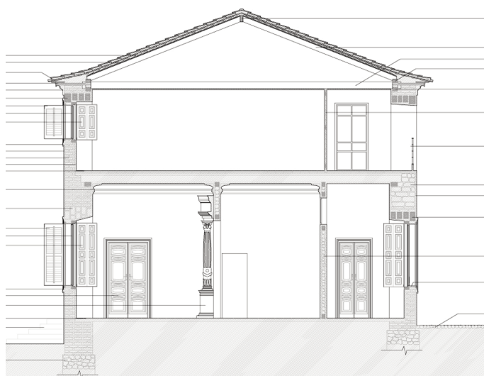
Fig. 5. Sección del Palacio de los duques de Osuna, ubicación de la portada de la alcoba de la duquesa (Gómez Atienza Arquitectos).

Podría surgir la duda de si Tolsá imprimió su estilo personal en esta obra a pesar de estar subordinado a Guill. Sin embargo, no parece que fuera así. Aunque, la obra de Aranjuez tiene un carácter ornamental y no tectónico, el hecho de que los elementos utilizados sean de tipo arquitectónico nos permite compararla con una realización también