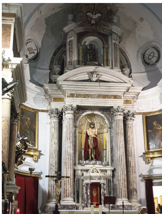
Fig. 6. Retablo mayor de la iglesia de la Conversión de San Pablo (Cádiz), ca. 1790, Manuel Tolsá.