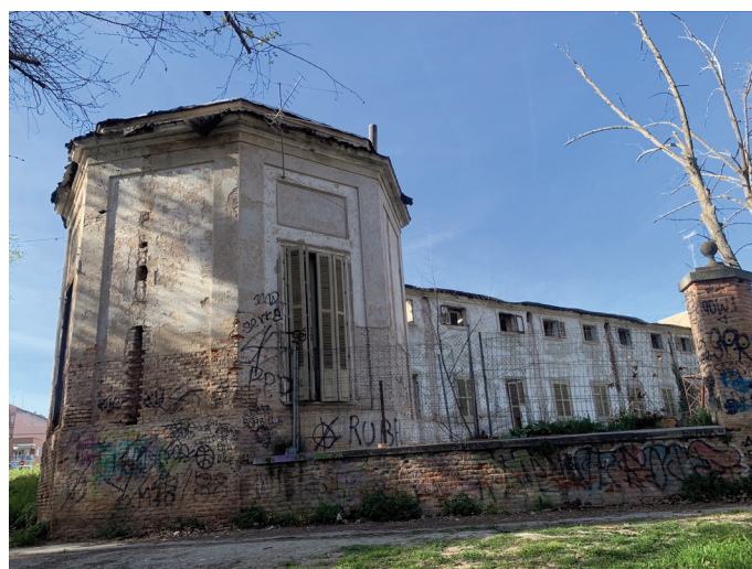
Fig. 2. Detalle del estado actual del Palacio de los duques de Osuna.

El que Manuel Tolsá, poco antes de marchar a México, trabajara en el palacio de los duques de Osuna en Aranjuez parece derivar de una vinculación anterior de Tolsá con el propio Guill. Tras la muerte de Carlos III, Madrid preparó la entrada solemne de Carlos IV como nuevo monarca, fiesta celebrada el 17 de enero de 1789. 18 Para estas celebraciones, se encargó un importante número de decoraciones para ornamentar los edificios públicos y privados más importantes. Este trabajo recayó, en gran medida, en los artistas de la Real Academia de Bellas Artes de San Fernando. Precisamente, Tolsá trabajó, junto a José Ripoll, en la elaboración de 9 medallones para la casa del conde de Campo Alange, sita en la calle Alcalá, en los que se relataban acontecimientos relevantes de los monarcas. 19 Es más que probable que Tolsá conociera en este momento a Mateo Guill pues este era el encargado de la decoración de la vivienda de los condes de Campo Alange.