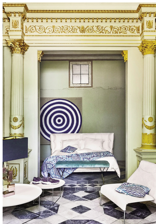
Fig. 4. Portada de la alcoba de la duquesa del Palacio de los duques de Osuna.

de recibir mucho peso 21 y "cuatro capiteles de pilastra", junto a sus basas, 22 todos ellos para el salón grande (Fig. 5).