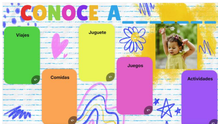
Figura 1. Cartel mapa de identidad. Actividad 3.