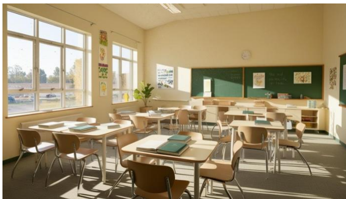
Figura 2. Aula de 4.ºESO, grupos.