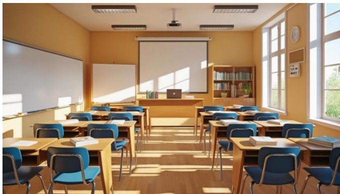
Figura 1. Aula de 4.ºESO, alumnado por parejas.