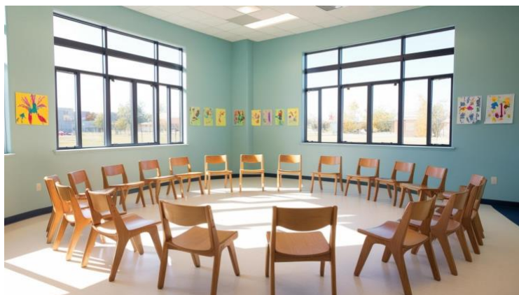
Figura 3. Aula 4.ºESO, sillas en círculo.