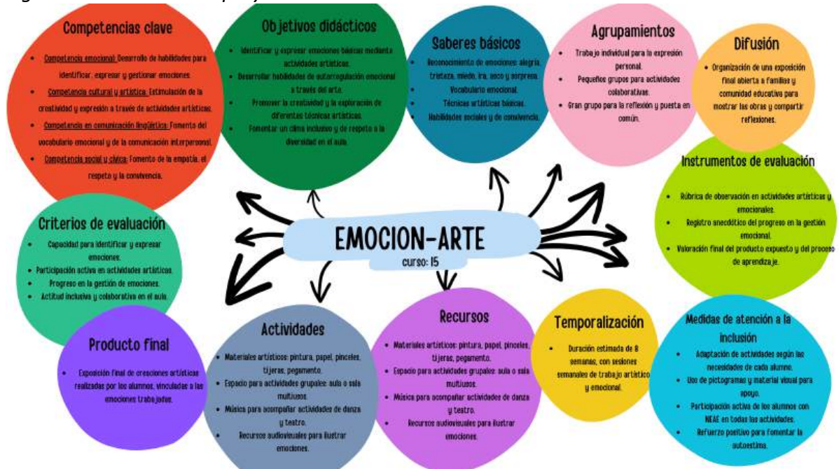
Figura 1: Estructura del proyecto.

Estructura para la propuesta de proyecto interdisciplinar sería la siguiente: