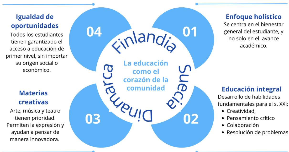
Figura 2. Pilares del modelo educativo nórdico.