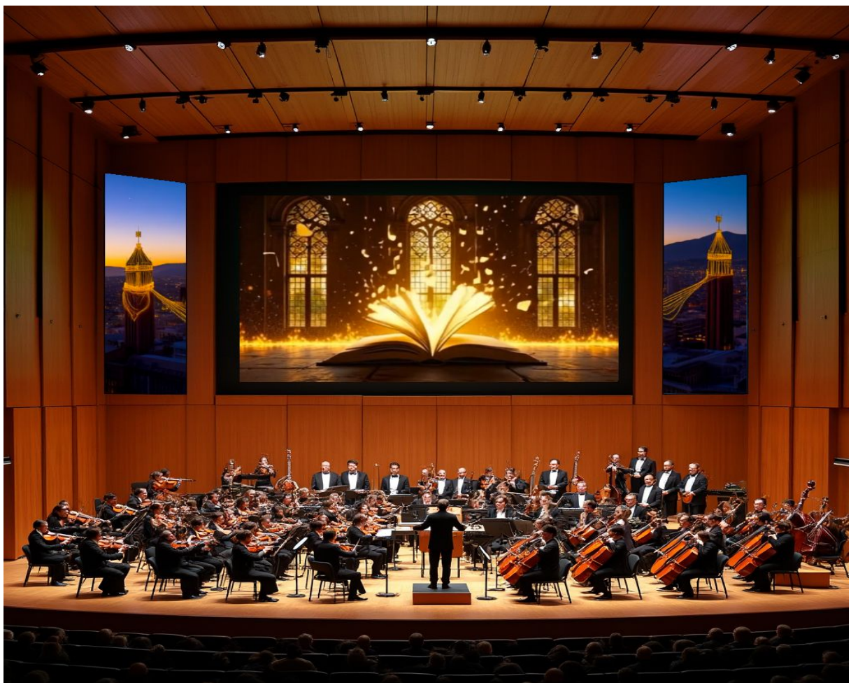
Vista general de la puesta en escena audiovisual dentro del auditorio