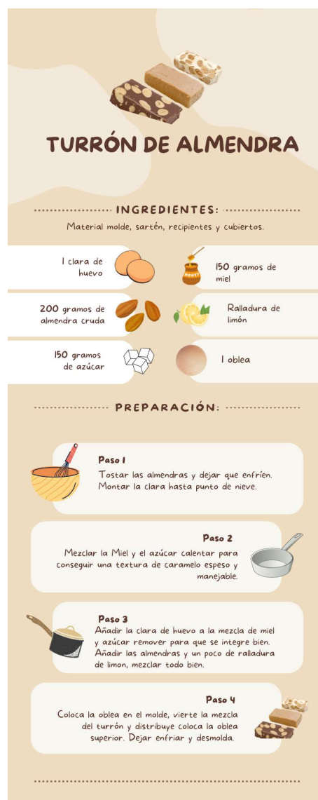
Figura 7. Receta Colombiana