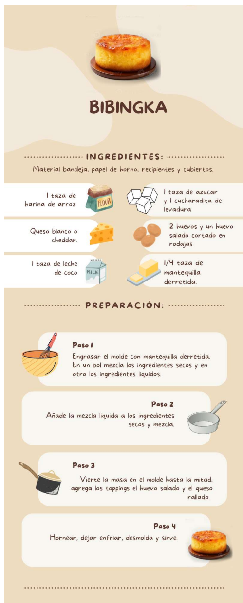
Figura 4. Receta Asiática