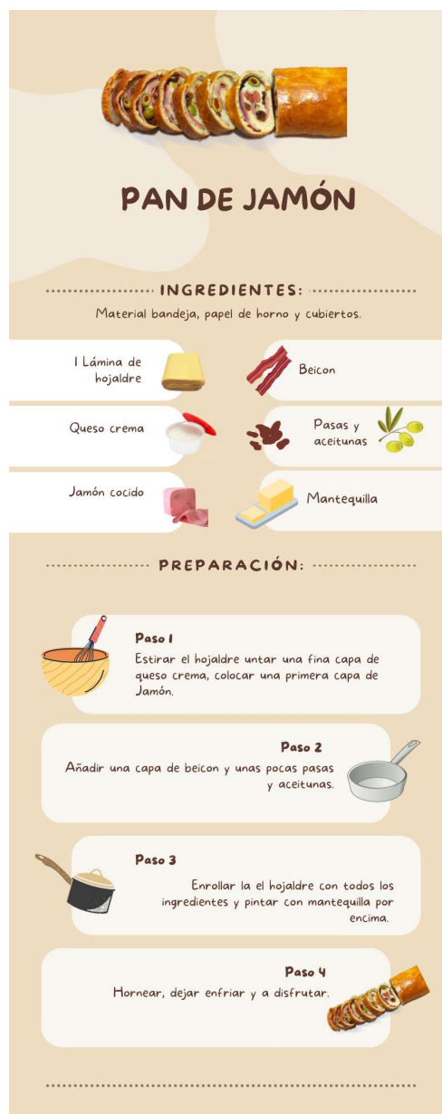
Figura 5. Receta Venezolana