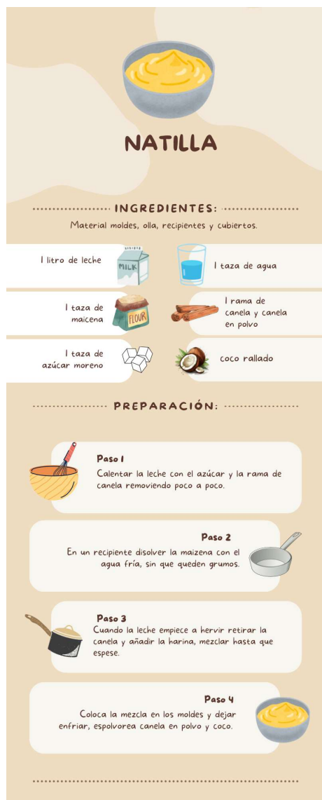
Figura 6. Receta Española