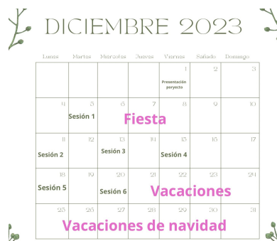
Figura1. Temporalización del proyecto

La temporalización de este proyecto se realizará en el mes de diciembre, ya que es el mes en el que se celebra la festividad de la Navidad, en las siguientes imágenes se observa la organización en el mes: