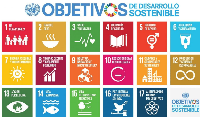
FIGURA 2. Imagen de los Objetivos de Desarrollo Sostenible (ODS)