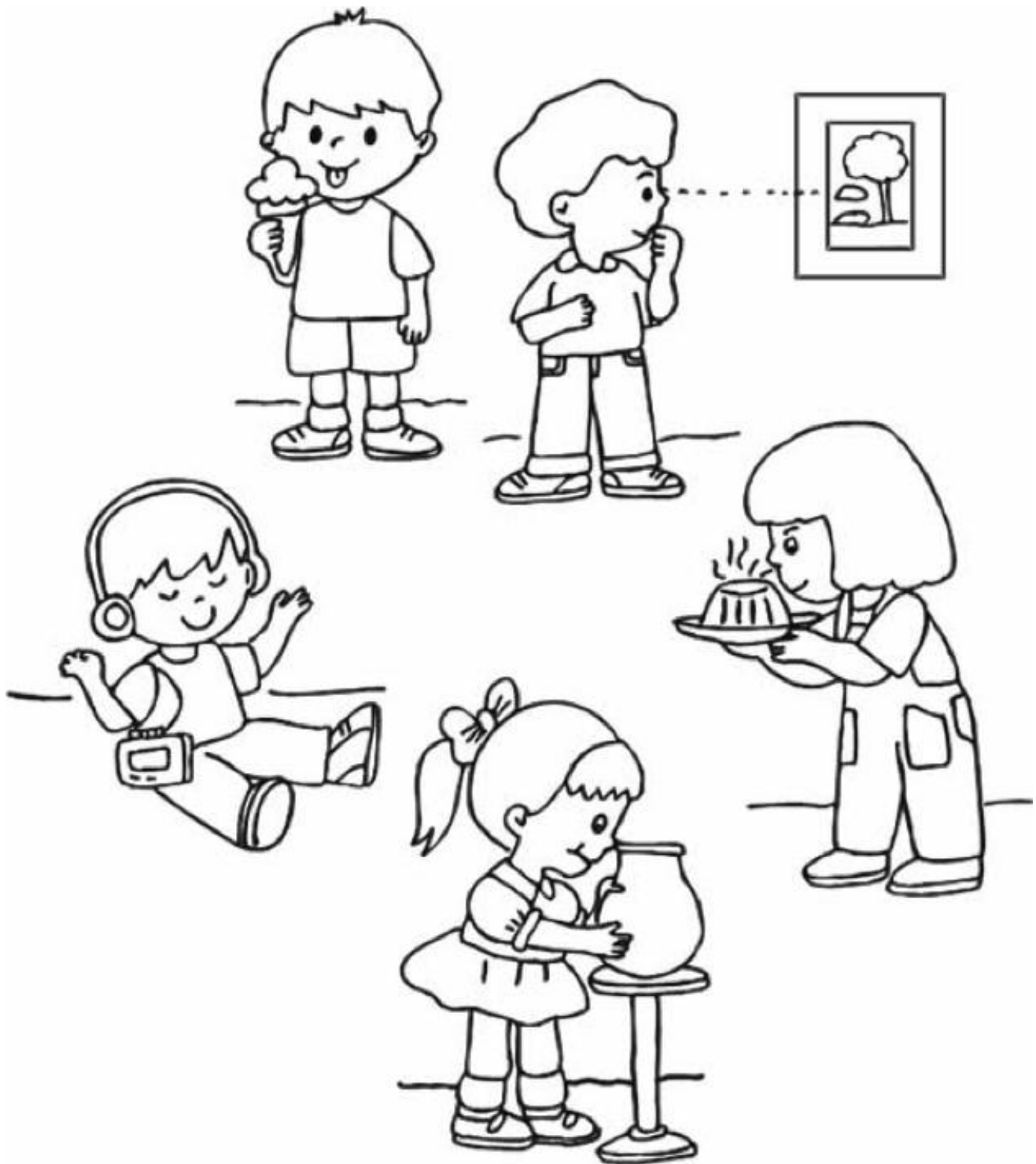
Fig. 4. Ficha de trabajo para la tercera actividad de la sesión 1 de la Propuesta Didáctica (Cuentos de Don Coco, 2009).