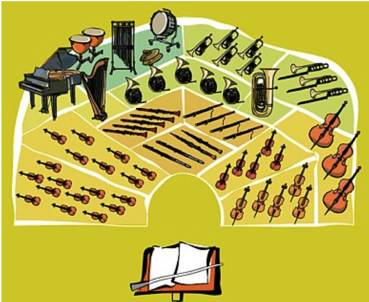
Fig. 6. Mural de trabajo para la segunda actividad de la sesión 2 de la Propuesta Didáctica (Camino Rentería, 2010).