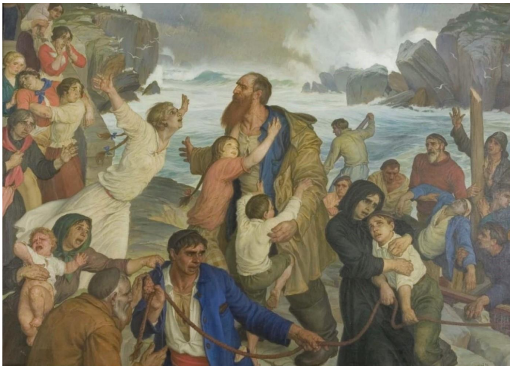
Óleo sobre lienzo, Museo Provincial de Lugo, Lugo. Depósito del Museo Nacional Centro de Arte Reina Sofía

Otras obras ponen el acento en el protagonismo del elemento meteorológico y la representación paisajística, como Naufragio (ca. 1940) de Evaristo Valle, relegando la angustiada tragedia humana a un discreto segundo plano.