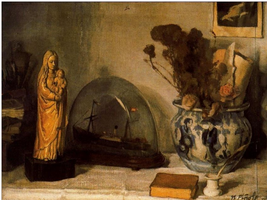
Óleo sobre lienzo, Museo de Bellas Artes de Asturias, Oviedo