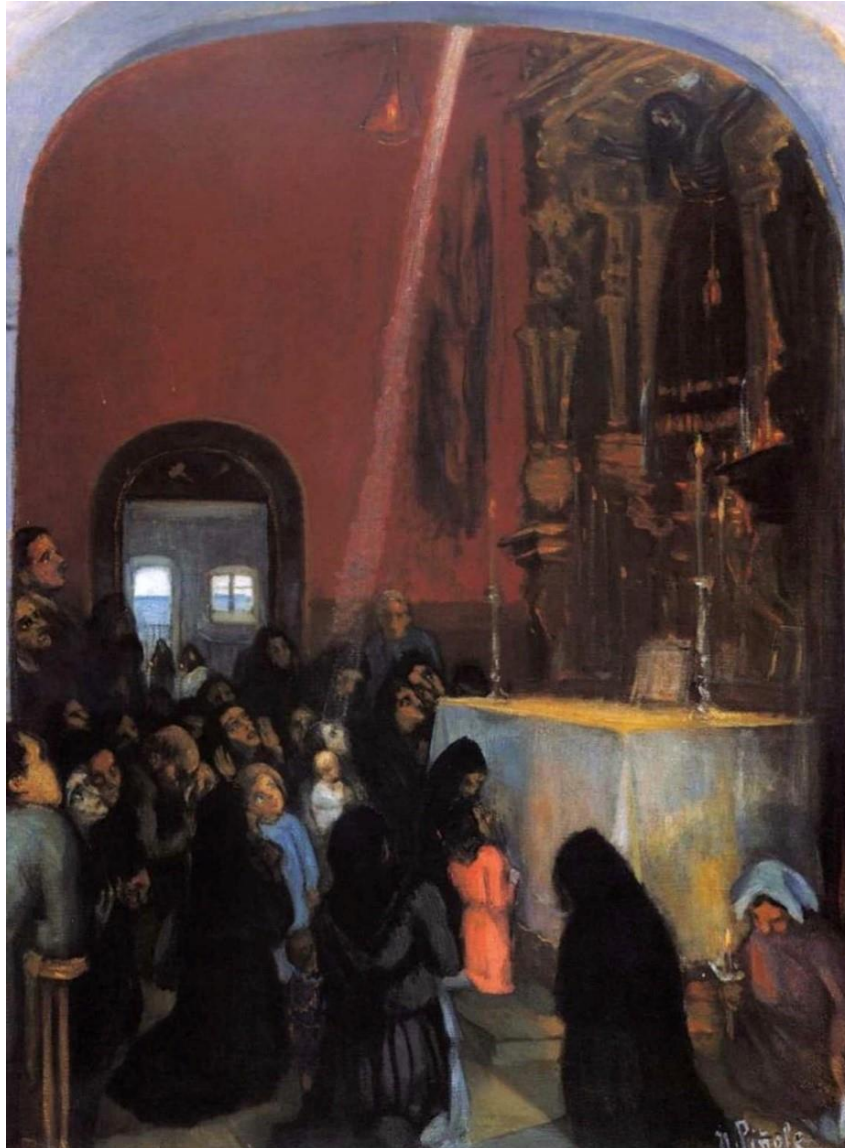
Óleo sobre lienzo, colección particular