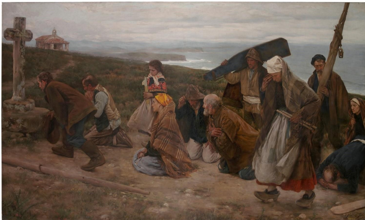
Óleo sobre lienzo, Museo de Bellas Artes de Asturias, Oviedo. Depósito del Museo del Prado

Contrastan con el paisaje exterior de La promesa otras escenas ambientadas en el interior de estos espacios sagrados, como El Cristo de Candás (1927) de Nicanor Piñole, localizado en la Iglesia de San Félix (fig. 10). De un modo similar al de otras imágenes, dice una leyenda que este Cristo fue encontrado en el siglo XVI por unos pescadores candasinos que cazaban ballenas en las costas irlandesas, donde le vieron flotar, trayéndolo consigo para más tarde incorporarlo a la construcción de un retablo (Rodríguez Muñoz 2006, 778-782). Otras fuentes amplían la información sobre la imagen, supuestamente arrojada al mar junto a otras por los piratas ingleses (de Llano 1928, 198) 15 , terminando por codificar una santidad de probada legitimidad salvadora (González de Posada 1794, 12-13) 16 . Asimismo, advertimos al Cristo de Candás en otros cuadros como La promesa (1928) de Antonio Rodríguez (Antón), una obra de juventud en la que el artista reinterpreta La promesa de Álvarez Sala ya en el paisaje de su villa natal y mediante la representación iconográfica propia del Cristo de Candás, dos motivos que le eran de sobra familiares. Fueron sus conocimientos sobre esta imagen sagrada los que le valieron la intervención en la reconstrucción del retablo local tras los desperfectos de la Guerra Civil 17 .