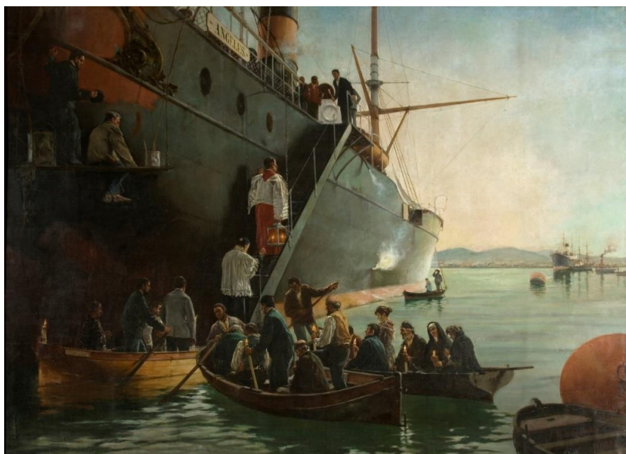
Fig. 6. Martínez Abades, Juan, El viático a bordo , 1890.

Óleo sobre lienzo, Museo de San Telmo, San Sebastián. Depósito del Museo del Prado