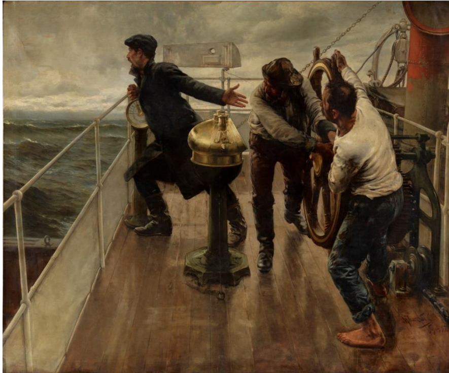
Fig. 5. Álvarez Sala, Ventura, ¡Todo a babor! , 1897.

Óleo sobre lienzo, Gobierno Civil de Barcelona, Barcelona. Depósito del Museo del Prado