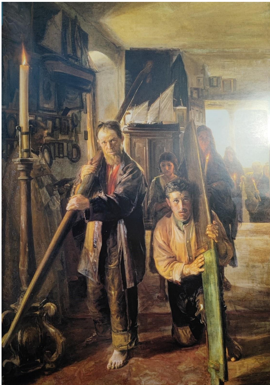
Óleo sobre lienzo, Colección Masaveu, Oviedo

Por un lado, los marineros ofrecen el remo y el timón del camarín, exvotos comunes de los pescadores más desfavorecidos, que carecían tanto de medios para encargar la elaboración del exvoto a algún artesano local como de la técnica y los conocimientos necesarios para confeccionarlo. Por otro, la localización del espectador en la cabecera de la capilla permite observar el rico inventario oferente, con reconstrucciones de barcos en miniatura y pinturas votivas de pequeño tamaño. Aunque sabemos que cualquier objeto relacionado con la mar podía ser ofrecido, caso de las guindolas con los nombres de los barcos, partes de la embarcación como fanales, campanas y remos, y aparejos empleados para la pesca, las maquetas y los cuadros aparecen constantemente. La naturaleza más bien modesta y homogénea de los exvotos ofrecidos por los marineros queda contrarrestada con la imagen de la capilla, en la que se rastrea aquella tendencia que comienza entre finales del siglo XVIII y principios del XIX para hablarnos de las mejoras técnicas de las que estas piezas son objeto. Es