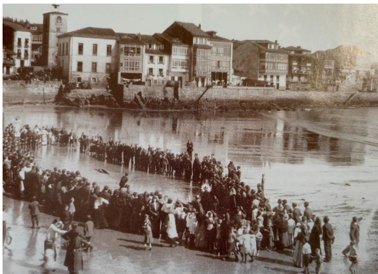
Fig. 7. Bosquets, Eduardo, Procesión de La Venia en la playa de La Ribera de Luanco , ha. 1915.

Fotografía reproducida en La obra fotográfica de Eduardo Bosquets, 1900-1920 (1996)