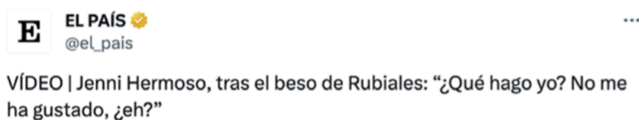
Imagen 1. Detalle del elemento escrito en el tuit publicado por El País en la red social X. (Fuente: https://twitter.com/el_pais/status/1693320385893171632 )

resumida de la noticia, sino que se utiliza como una herramienta persuasiva de aquellas personas usuarias de esta red, al incitarlas a acceder a los enlaces o a visualizar los elementos audiovisuales que suelen complementar el mensaje textual que se ofrece. Veámoslo con el siguiente ejemplo: