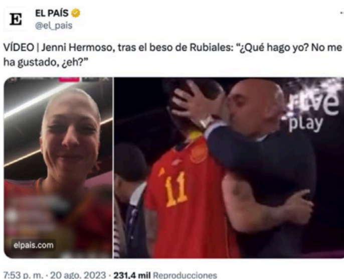
Imagen 2. Detalle del hipervínculo visual utilizado por El País en la red social X. (Fuente: https://elpais.com/deportes/mundial-futbol-femenino/2023-08-20/video-jenni-hermoso-tras-el-beso-de-rubiales-que-hago-yo-no-me-ha-gustado-eh.html?ssm=TW_CM )