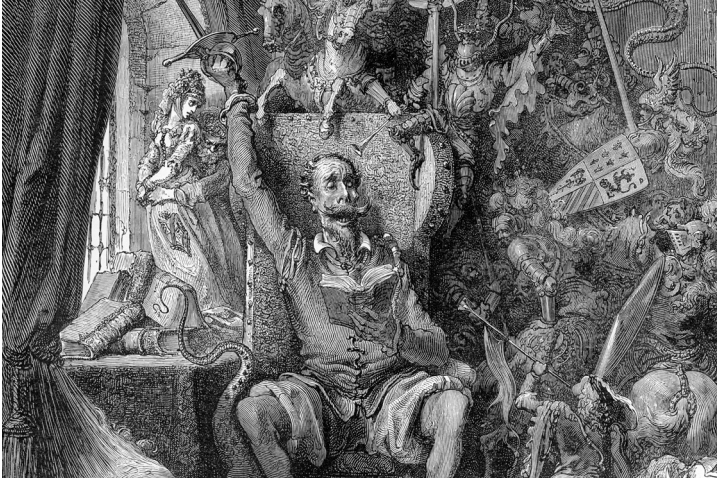
Ilustración del Quijote , de Gustave Doré.