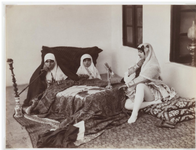
FIGURA 9. Antoin Sevruguin. Two Ladies and a Child Resting in the Harem , finales del siglo XIX. © Brooklyn Museum, Nueva York.

Scheiwiller, en sus investigaciones acerca de la figura de Sevruguin, destaca que “los académicos lo han identificado y descrito de varias maneras que afectan nuestras interpretaciones de él y de su obra, como llamarlo ‘occidental’, ‘orientalista’, ‘ruso’, ‘georgiano’, ‘armenio’, ‘iraní’, o una combinación de dos o más” (Scheiwiller 2018b, 145). En consecuencia, la obra fotográfica de Sevruguin supone un compendio de todos esos calificativos y, por extensión, un fiel retrato de la sociedad iraní de finales del siglo XIX y principios del XX, en ese basculamiento entre tradición y modernidad, que ofrece una gran variedad de tipos populares y representantes de los estratos de la sociedad.