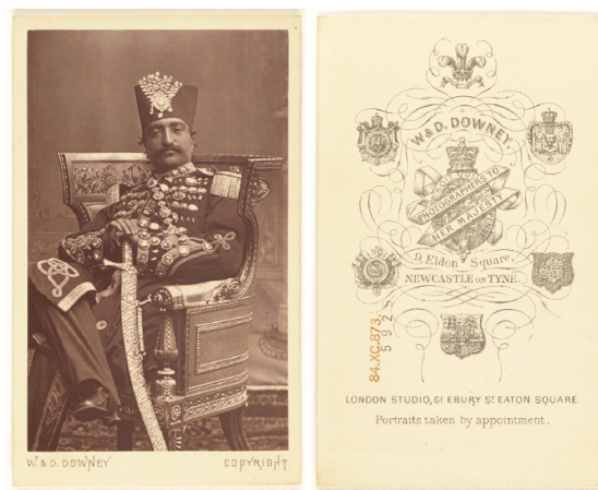
FIGURA 2. W. & D. Downey. [ Nasar al-Din Shah Qajar ], ca. 1865. © The J. Paul Getty Museum, Los Ángeles.

sah: “en la Sala de los Espejos, se fotografía a partir de los reflejos en el espejo; yo también estoy en la foto” (Tahmasbpour 2010, 37).