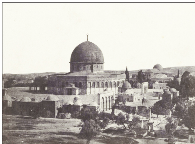
FIGURA 1. Maxime du Camp. Palestine. Jérusalem. Mosquée d'Omar , 1850.

La primera fotografía tomada en Oriente Próximo y publicada en Europa apareció en septiembre de 1851 2 en el Album Photographique de l'Artiste et de l'Amateur , del fotógrafo y editor francés Blanquart-Evrard (1802-1872), una recopilación de imágenes tomadas en Francia, Italia, Bélgica, India, Grecia y Palestina por varios autores, entre los que se encontraban Maxime du Camp (1822-1894), el barón Alexis de Lagrange (1825-1917), Louis-Alphonse de Brébisson (1798-1888) y Ernst Benecke (1817-1894), según el modelo de las Excursiones daguerrianas del óptico y editor francés Noël-Marie Paymal Lerebours (1807-1873) (Lerebours 1840). Blanquart-Evrard incluyó una fotografía de Du Camp titulada Jérusalem. Mosqué d'Omar , 1850, 3 que correspondía a una vista general de la explanada de las mezquitas de Jerusalén (figura 1).