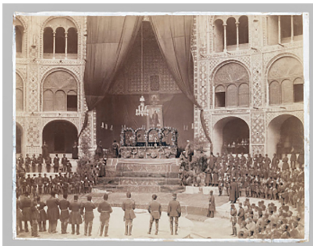
FIGURA 10. Autor desconocido. The Late Nasir al-Din Shah Lying in State in the Takiah Dawlat, One of 274 Vintage Photographs , 1896. © Brooklyn Museum, Nueva York.

Mirza Qajar retrató el paso de la comitiva fúnebre por las calles de Teherán, y el Brooklyn Museum conserva una fotografía anónima del lecho fúnebre en el Palacio del Golestán (figura 10). ❖