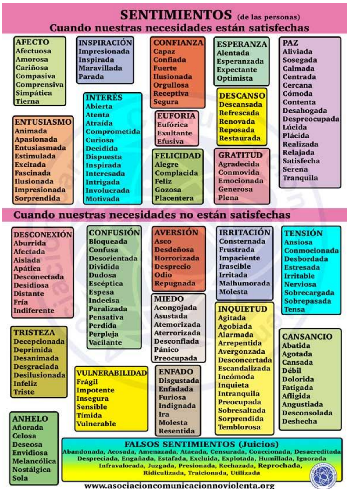
Ilustración 1. Listado de sentimientos.