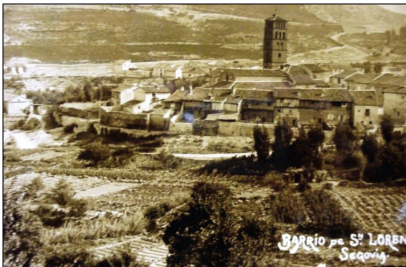
Imagen 2. Barrio de San Lorenzo

últimos en continuo retroceso. También era destacable en 1860 la presencia de un nutrido número de molineros y de canteros. El que apareciera nueve canteros inscritos en el padrón desapareciendo en los años siguientes, era debido a una circunstancia eventual; en este momento se estaba construyendo el puente de San Lorenzo sobre el río Eresma y trajeron a estos canteros para su construcción, empadronándoles de forma transitoria junto a la obra 62 . Esta situación residencial refleja el matiz poblacional, en el que los alquileres eran bajos o directamente inexistentes, quedando integrados en la casa donde trabajaban o en construcciones de carácter temporal. Por su parte, la distribución de las familias se realizaba bajo la forma nuclear, con porcentajes superiores al 80% en los años 1881 y 1905.