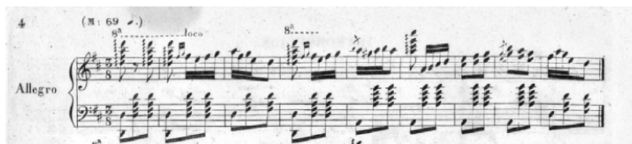
Figura 8. F. Lahoz. Introducción y gran jota aragonesa , tema 27

En esta versión extendida de 1841 se observan ya los dos temas principales utilizados por Liszt y Glinka, el inicial, de corte percusivo y dinámico, y el canto quinto, como tema cantabile , dispuesto en tercetas, bajo un trino largo, que adolece, sin embargo, en la parte del acompañamiento, de las quintas paralelas censuradas por los tratados de armonía: