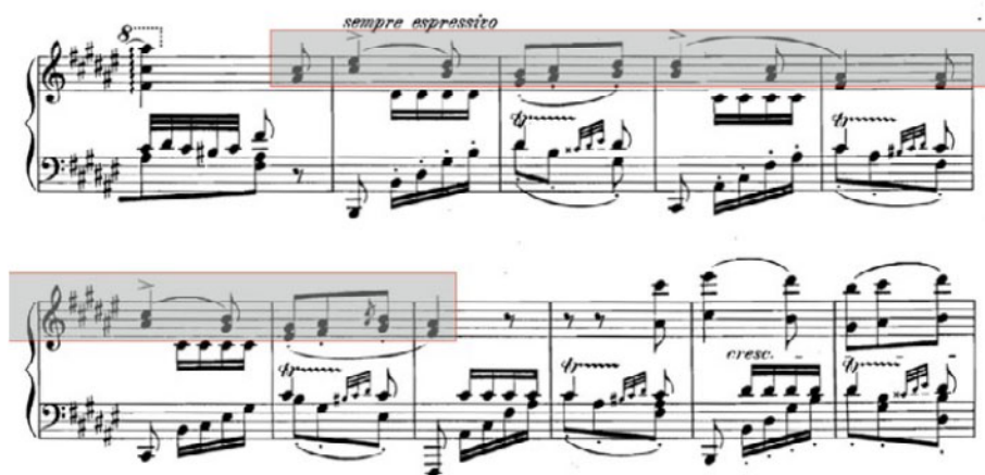
Figura 1. F. Liszt. Konzertfantasie... , tema de jota 7

En el manuscrito, bajo la anotación «Lisbonne, 2 février, [18]45», se observa una obra de gran complejidad pianística, articulada a partir de tres temas principales: un fandango; un bolero conocido como «La cachucha», popularizado en Europa desde 1836 en el ballet Le diable boiteux : [ El diablo cojuelo ] que le había valido a la bailarina Fanny Elssler un éxito espectacular en París, donde Liszt habría podido escucharlo antes de su gira española, y un tema de jota aragonesa de corte nostálgico y espressivo , según las anotaciones del compositor: