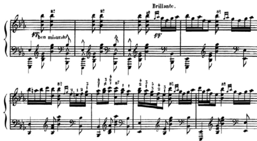
Figura 14. L. M. Gottschalk. La jota aragonesa Op. 14 (1852) 51

obertura orquestal—, lo que explicaría la insólita rapidez con que la fantasía para diez pianos había sido compuesta en su día. En realidad, la tonalidad de la obra, de nuevo, Mi bemol mayor, no sólo coincide con la utilizada por Iradier y Glinka, sino, también, con la de Pauline Viardot, entre muy diversas ornamentaciones colorísticas de efecto virtuoso: