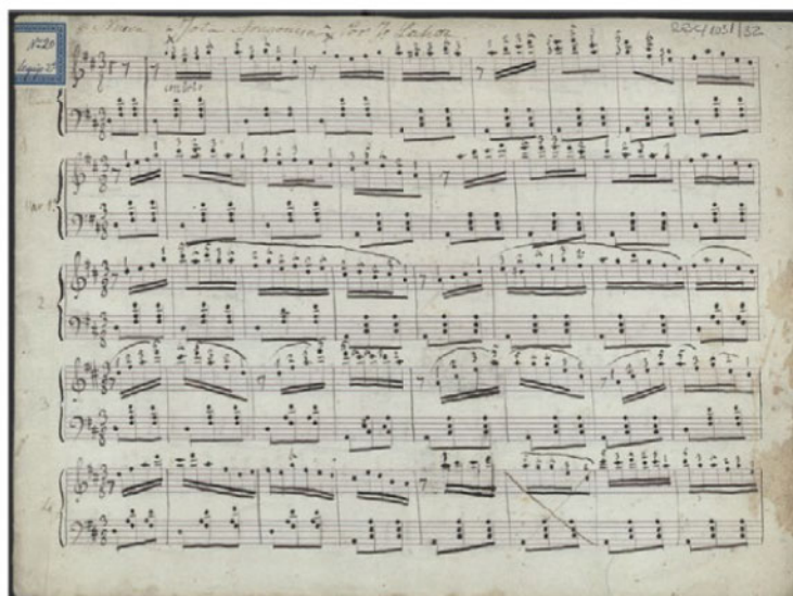
Figura 7. F. Lahoz. Nueva jota aragonesa , tema y cuatro variaciones (circa 1840) 23

Dado el éxito de la obra 24 , interpretada en los salones madrileños por el mismo autor, se volvió a reeditar hasta dos veces, comercializada por Lodre (Carrera de San Jerónimo, 13) y Carrafa (Calle del Príncipe, 15) 25 , dedicada a Pedro Albéniz, ampliada, desde el mismo tema inicial, con introducción, cinco cantos y cuarenta y dos variaciones, según consignaba la prensa de la época: