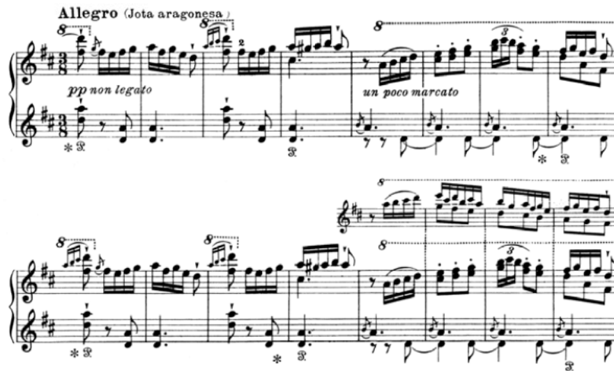
Figura 5. F. Liszt. Rhapsodie espagnole , primer tema de jota aragonesa (1864) 20