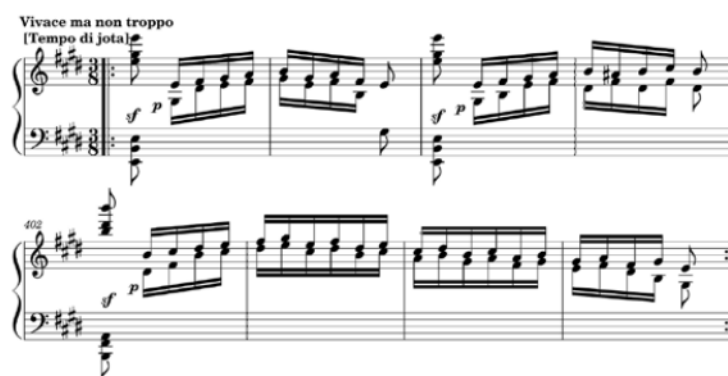
Figura 2. F. Liszt, Romancero espagnol , jota aragonesa 9

terminada, cuyo manuscrito fue descubierto (y ordenado) por el pianista Leslie Howard en el Goethe- und Schiller-Archiv Klassik Stiftung Weimar y, finalmente, publicado en el Liszt Society Journal (2009). Esta obra contenía, asimismo, un nuevo tema de jota, muy distinto al anterior, dinámico y con diversos efectos percusivos: