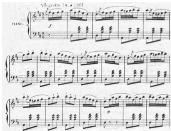
Figura 18. P. Lacôme (ed.) Jota aragonaise «anónima» 59

...el volumen recopilatorio presentaba hasta siete números de jota, «una de las danzas más populares de España y la danza nacional por excelencia de Aragón», incluyendo la de Lahoz y algunas de sus variantes, cuya última edición en Francia había corrido a cargo de Iradier: