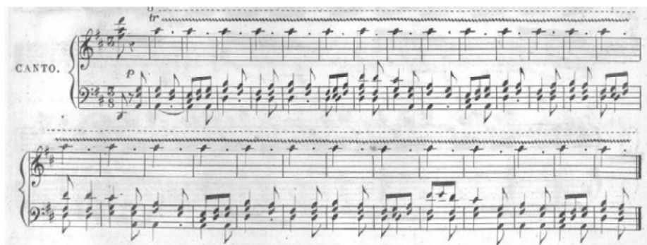
Figura 9. F. Lahoz. Introducción y gran jota aragonesa , canto quinto 28

Pero, a pesar de sus oscuros orígenes 29 , la jota estaba de moda en Madrid antes de la llegada de Lahoz. Fue muy conocida la llamada Jota de La pata cabra , perteneciente a la comedia homónima 30