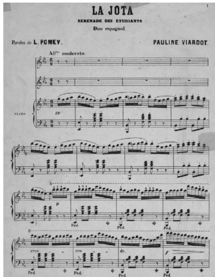
Figura 11. P. Viardot-García. La jota (1876) 43

Esta obra, elaborada con estribillos y coplas alternas, al contrario que Florencio e Iradier, contiene el tema inicial de La nueva jota aragonesa de Lahoz como ritornello y la copla final de cierre de La jota de las avellanas de Iradier, con una textura pianística muy similar en el acompañamiento a las versiones anteriores, como se puede observar en los ejemplos aportados, junto a la alternancia armónica de la