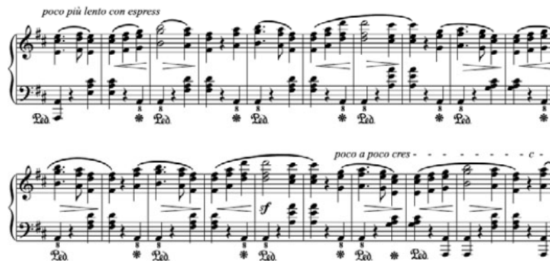
Figura 13. J. Fontana. La Havanne, Jota aragonesa , segundo tema 47

Con tal parecido, es complicado pensar que Fontana pudiese reproducir en su obra los temas de Florencio Lahoz, en la misma tonalidad original, desde La Habana o, incluso, desde París, sin la influencia del círculo de Chopin, quien escribía a sus hermanas en 1845: