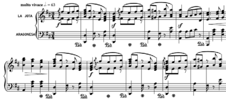
Figura 12. J. Fontana. La Havanne, Jota aragonesa , primer tema 46