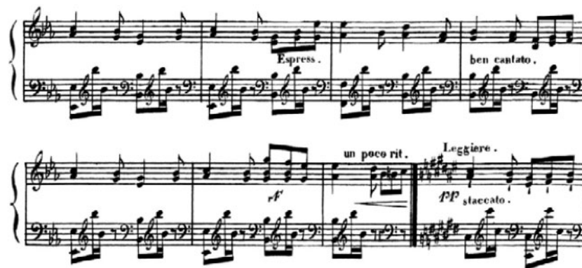
Figura 15. L. M. Gottschalk. La jota aragonesa Op. 14 (1852) 52