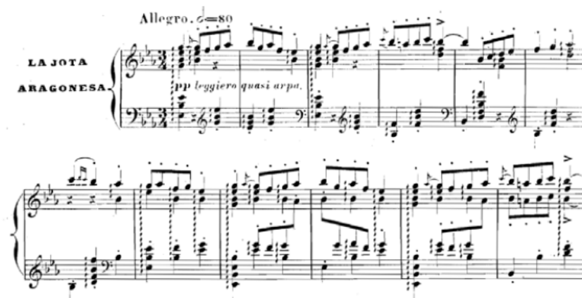
Figura 3. M. Glinka. Capriccio brillante sur le thème de la Jota aragonesa , primer tema (1845) 17

En primer lugar, la melodía principal, interpretada por un grupo de violines solistas con precisos golpes de arco, spiccato assai , y doblada por el toque etéreo del arpa, presenta ecos de cuerda pulsada, quasi rondalla , en tonalidad de Mi bemol mayor: