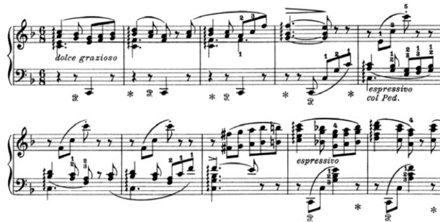
Figura 6. F. Liszt. Rhapsodie espagnole , tercer tema de jota aragonesa (1864) 21