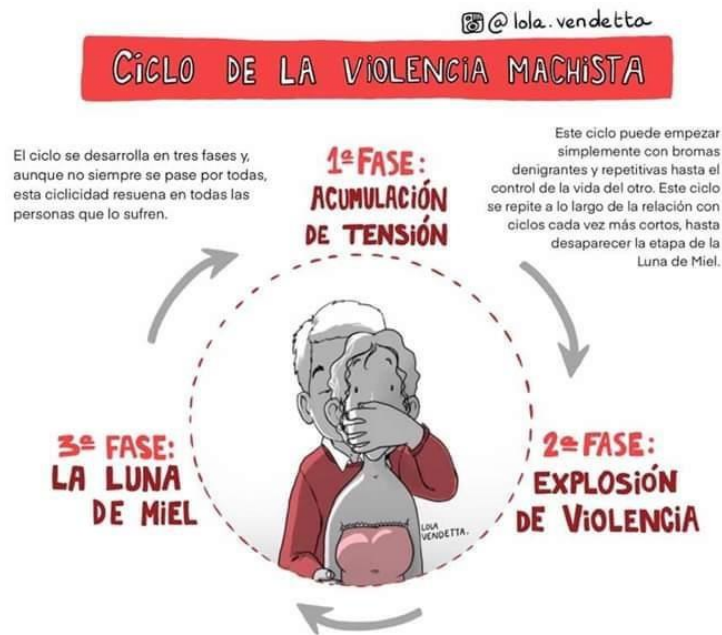
Figura 2. Ciclo de la Violencia de Género.