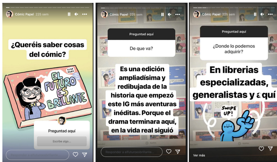
Figura 5: Capturas de pantalla del perfil @elfuturoesbrillante donde el CTA se realiza a modo de story interesándose por responder dudas que los seguidores puedan tener respecto a la publicación en papel. Publicaciones del 2018 fijadas en el feed del perfil. Fuente: https://www.instagram.com/stories/highlights/17946951088250651/ .

redes humanas se generan más allá de los espacios virtuales, creando vínculos que pueden ser genuinos en el mundo real (Van Dijck, 2019; Centenero, 2019).