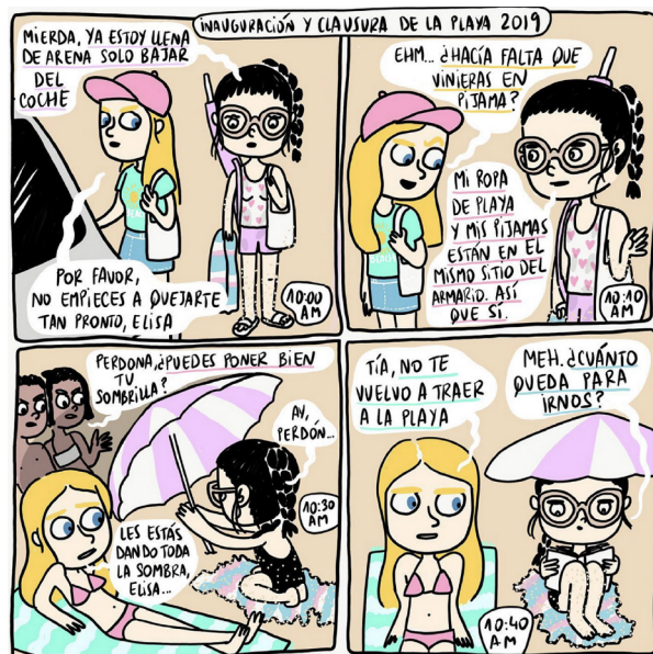
Figura 3: (derecha). Captura del perfil de @elfuturoesbrillante donde se puede observar el uso del muro como retícula.