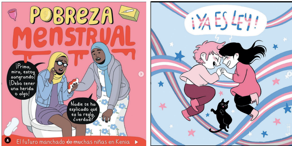
Figura 2: De izquierda a derecha. Publicación en Instagram de @modernadepueblo acerca de la pobreza menstrual en colaboración con el proyecto solidario Save a girl. Save a generation (marzo, 2023). Fuente: https://www.instagram.com/p/CsyF3xrtSDn/ Publicación en Instagram de @sarasoler_art el día que se aprobó la llamada "Ley Trans" en España (febrero, 2023). Fuente: https://www.instagram.com/p/CsyF3xrtSDn/

Las experimentaciones formales con los cómics digitales continúan y crean diferentes subproductos y categorías que, difícilmente, pueden ser adscritas a una u otra clasificación y, si bien, la teoría gusta de catalogar y diferenciar web-cómic de cómic digital, lo cierto es que esta distinción es más operativa que esencial. Los webcómics pueden leerse desde cualquier sitio web o plataforma y los cómics digitales requieren de aplicaciones o herramientas concretas para poder verlos correctamente. Sin embargo, tanto uno como otro, exploran nuevos flujos de lectura y estructura narrativa, con independencia de si se necesita una app específica o simplemente un navegador. Prueba de ello pueden ser los trabajos interactivos de Daniel Merly Goodbrey 1 ; otras obras experimentales como Modern Polaxis , que necesitan de otros dispositivos móviles, puesto que introducen tecnologías disruptivas como la realidad aumentada para su lectura (Sánchez de Mora, 2021), u obras que exploran la temporalidad expandida y la transmedialidad (Montoya, 2018).