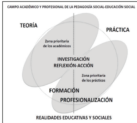
Figura 1. La convivencia de académicos y profesionales en la pedagogía social y la educación social