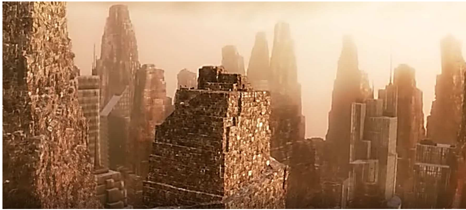
Figura 1. Imagen de la película Wall-E (Walt Disney Pictures y Pixar Animation Studios, 2008)

Descripción: En la primera escena se observa un paisaje repleto de basura, restos, metal, construcciones de chatarra y un robot, Wall-E, que gestiona dicha chatarra. En esta ciudad de chatarra se observan múltiples anuncios de la compañía BnL, incluso videos promocionales de un crucero de cinco años al espacio para que la compañía limpie la Tierra en su ausencia.