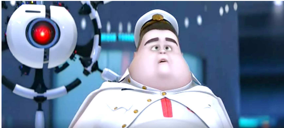
Figura 3. Imagen de la película Wall-E (Walt Disney Pictures y Pixar Animation Studios, 2008)

Descripción: La escena comienza con las imágenes de los comandantes que ha tenido la nave espacial y el estilo de vida del actual. Se muestra el trabajo diario del comandante repasando los parámetros básicos que marca el protocolo y dando el anuncio del tiempo y de que llevan 700 años en la nave, haciendo lo mismo. Tras la detección de alarma de vida, se activan las alarmas y aparece el portavoz de BnL diciendo que ya pueden volver a casa, se activa la recolonización de la Tierra.