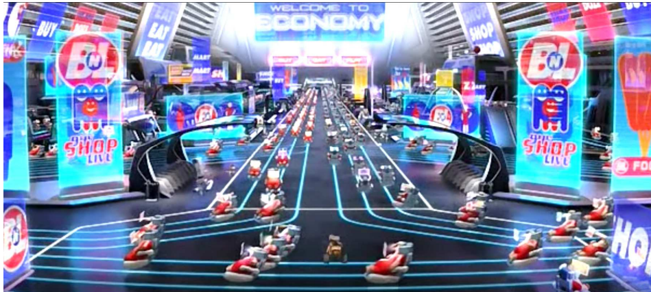
Figura 2. Imagen de la película Wall-E (Walt Disney Pictures y Pixar Animation Studios, 2008)

Descripción: Los robots llegan a la nave y allí hay otros robots que se mueven perfectamente programados, siguiendo las líneas del suelo. En la nave, EVE es transportada hacia el comandante mientras Wall-E intenta seguir su rastro por toda la nave. Durante el camino Wall-E descubre el extraño modo de vida de los humanos y los robots en el espacio.