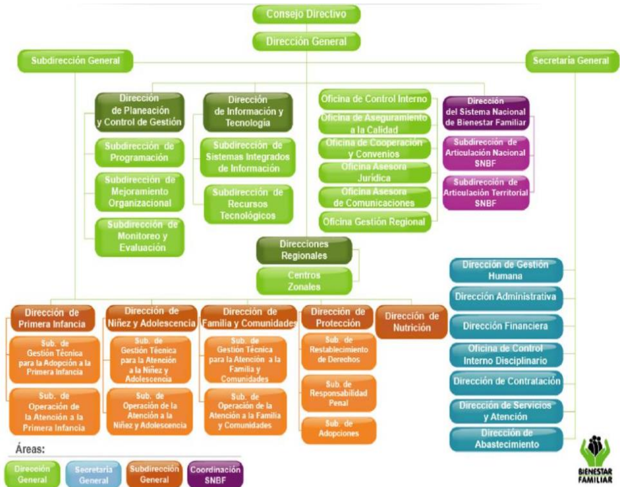
Estructura Organizacional del Instituto Colombiano de Bienestar Familiar – ICBF

Nota: Adoptado de Slide Player de Instituto Colombiano, Sistema Integrado de Gestión del ICBF.