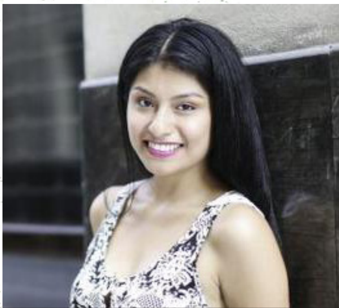
Similar a la cantante Wendy Sulca

Cuando su padre ingresa a prisión, es llevada a un orfanato. No quiere saber de su padre, aunque luego se sensibiliza ante las palabras de amor de su padre, dejando el resentimiento atrás.