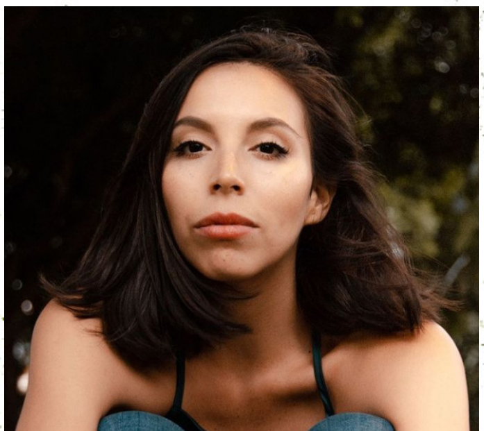
Similar a la actriz Belú Idrobo

Confía en su defendido, pero ante los desacatos de Armando dentro de la cárcel, ella se vuelve más severa, desconfiada y con una sensibilidad más reservada.