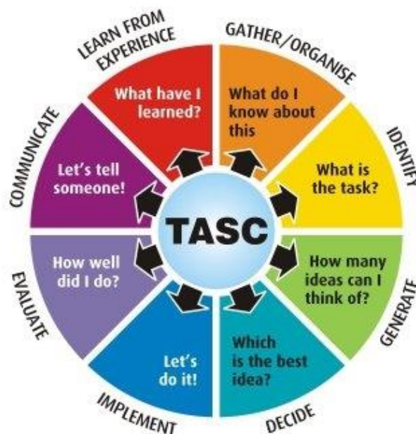
Figura 4. Metodología Thinking Actively in a Social Context TASC.

La metodología Thinking Actively in a Social Context TASC complementa el aprendizaje basado en proyectos asociando cada una de las tareas del proyecto a los niveles de la taxonomía de Bloom.