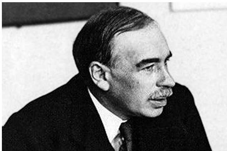
Imagen de John Maynard Keynes en 1933.