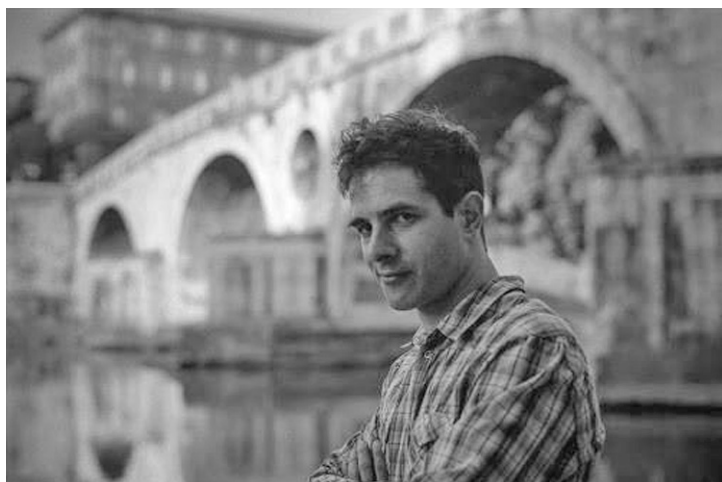
El economista italiano Emanuele Felice.