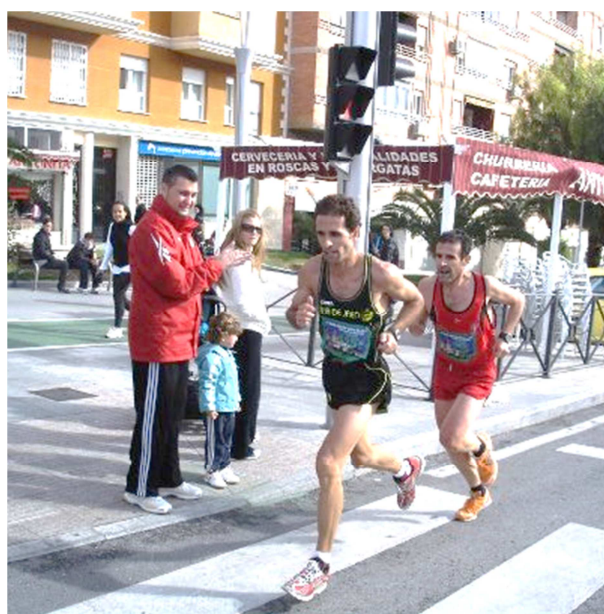
Foto 1. Dos corredores veteranos en pleno esfuerzo en una media maratón.

Salas et al., (2013) destacan dentro del perfil sociodemográfico del atleta veterano los siguientes descriptores: es un varón en torno a los 40 años (Foto 1), con estudios universitarios, que trabaja y vive en pareja y que entrena 4 días a la semana. El nivel de las sesiones de entrenamiento predominante son las de intensidad media y recorre en torno a 50 kilómetros semanales, la mayor parte de los kilómetros son recorridos por asfalto. Usa zapatillas caras (por encima de 100 euros), el 85.1% no está federado, el 93.6% no tiene entrenador y realiza unas 11 competiciones anuales. La lesión es frecuente en este deportista, afecta al 53,7% de los practicantes y los factores que predisponen a la lesión son el número de sesiones semanales de entrenamiento y los kilómetros realizados. La lesión más habitual es la tendinitis. En otro estudio se destaca que los corredores veteranos eran mayoritariamente hombres, tenían 7 o más años de experiencia en la carrera, corrían más de 30 millas / semana, 6 o más veces / semana y usaban más aparatos ortopédicos que los corredores más jóvenes (McKean, Manson, & Stanish, 2006).