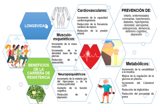
Figura 1. Beneficios de la carrera de resistencia, así como su efecto en la prevención de enfermedades. Adaptado de Lee et al. (2017).

Por tanto, correr, como AF aeróbica vigorosa, tiene numerosos beneficios para la salud y algunas pruebas indican que los beneficios aparentemente se maximizan con dosis bastante bajas de carrera y aunque puede haber algunas consecuencias negativas para la salud del entrenamiento extremo, los beneficios generales de correr superan los riesgos para la mayoría de las personas (Lavie et al., 2015).