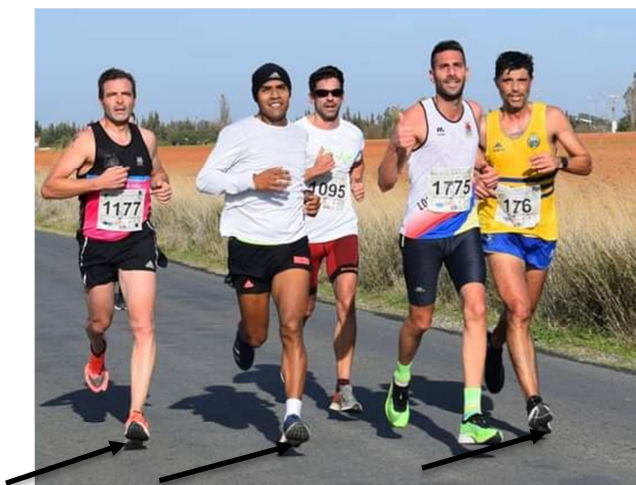
Foto 2. Corredores de fondo con apoyo retrasado o rearfoot strike .

2010). La mayor parte de los corredores de resistencia (75-95%) aterrizan de talón (Larson et al., 2011; Muñoz-Jimenez, Latorre-Román, Soto-Hermoso, & García-Pinillos, 2015) (Foto 2). Lieberman et al. (2010) sugieren que en los corredores descalzos con un apoyo de metatarso ( Forefoot strike ), la magnitud de la fuerza vertical máxima durante el período de impacto es aproximadamente tres veces más baja que en los corredores descalzos o calzados con un apoyo de talón o rearfoot strike (RFS). En este sentido, puede ser que los corredores que habitualmente golpean con el retropié tengan tasas significativamente más altas de lesiones por esfuerzo repetitivo que aquéllos que principalmente golpean con el antepié (Daoud et al., 2012). Por tanto, correr con calzado convencional y maximalista puede imponer mayores exigencias a las estructuras músculo-esqueléticas para atenuar los impactos, que pueden ser perjudiciales para los tejidos pasivos (Kline et al., 2015). En este sentido, es de destacar que la fuerza de reacción vertical inicial del suelo y la tasa de carga vertical aumentan tanto en los corredores masculinos como femeninos adultos mayores en comparación con los corredores más jóvenes, por lo que los corredores mayores tienen una menor capacidad para absorber fuerzas pasivas durante la carga y una menor capacidad para generar fuerzas excéntricas activas (Kline et al., 2015).