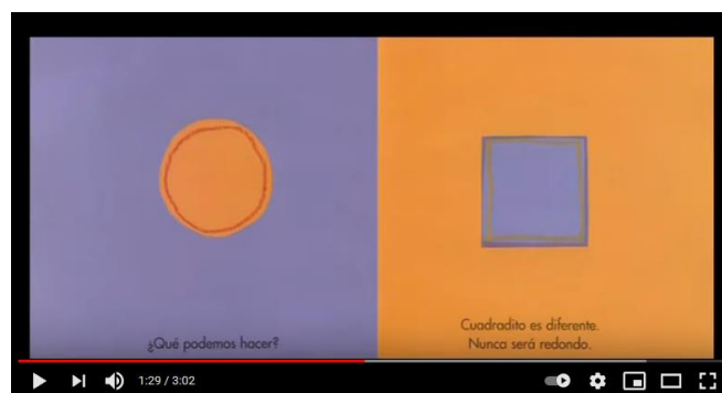
Figura 3. Representación de imagen del vídeo en el segundo 1:29.