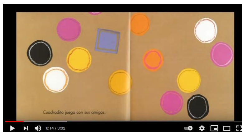
Figura 1. Representación de imagen del vídeo en el segundo 14.