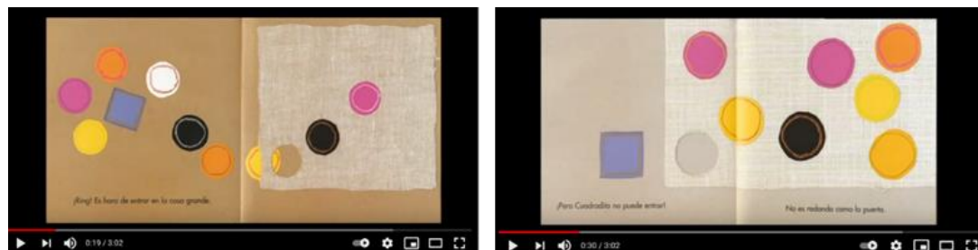
Figura 2. Representación de imagen del vídeo en el segundo 19 y en el segundo 30.