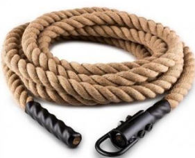
Anexo 7: Cuerda