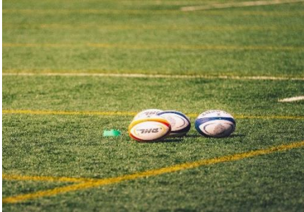
Anexo 1: Balones de Rugby