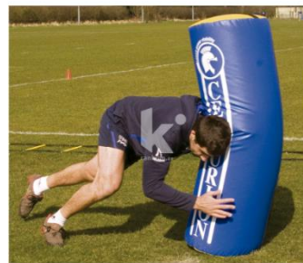
Anexo 4: Saco de placaje