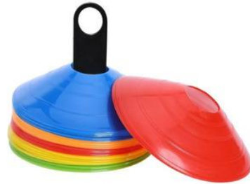
Anexo 2: Conos