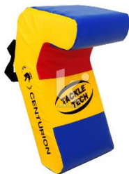
Anexo 5: Escudo de placaje