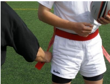
Anexo 3: Cintas Rugby Tag