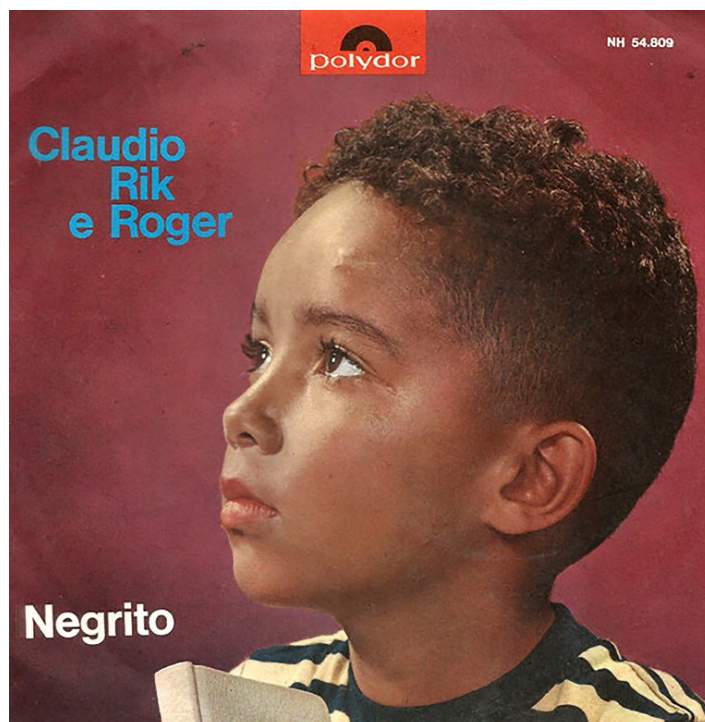
Figura 1. Portada del single Negrito (Claudio, Rik e Roger, 1964). (Bermúdez, 2018: 12)

musical titulado “Negrito” (Claudio, Rik e Roger, 1964). La misma palabra (“negrito”), verbalizada por el niño con el que Bermúdez se encontró en el mercado, se identifica ahora con el disco de un trío italiano de pop. En esta portada (Imagen 1), la fotografía de un niño afrodescendiente que mira hacia el horizonte nos traslada a otra previa en la que el autor sostiene la misma pose durante su infancia. Así, se establece una relación de continuidad y semejanza entre las imágenes y las palabras. Además, se conecta una anécdota personal con una producción cultural, lo que establece una pauta que se repetirá a lo largo del texto.