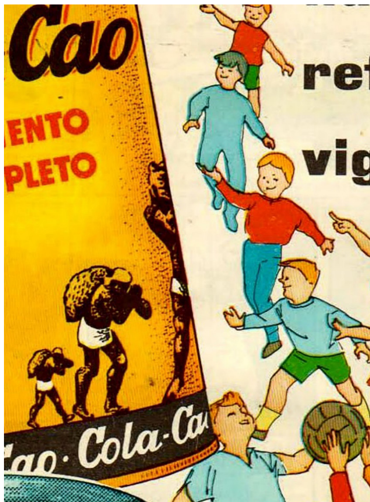
Figura 2. Publicidad de Cola Cao (1965). (Bermúdez, 2018: 25)

Este anuncio pone en escena dos imaginarios opuestos en función de la identidad étnico-racial. Uno está relacionado con la negritud, que se asocia al trabajo y la esclavitud. El otro, el blanco, a la despreocupación y el juego. La publicidad y las marcas también transmiten valores y, en este caso, la composición visual concreta un imaginario cultural dicotómico que remite al pasado colonial y la esclavitud. De esta manera, el autor reflexiona en torno a un modo de representar la dialéctica entre la identidad blanca y la negra, que es resultado de un pasado que pervive en el imaginario cultural de la nación en la que crece.