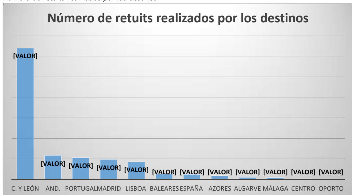
Número de retuits realizados por los destinos