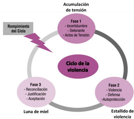
Figura 1. Teoría del ciclo de la violencia.