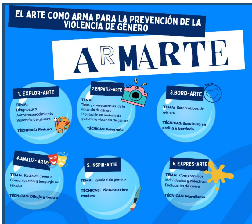
Figura 2. Esferas proyecto de intervención social ARMARTE.

A partir de lo expuesto en los anteriores apartados, se consideró importante diseñar un programa de intervención para la prevención de la violencia de género dirigido a los adolescentes del departamento de Boyacá, específicamente de la Institución Educativa Región Sur de Aquitania, dicho programa pretende usar el arte como medio para la transformación de tejido social, por ello se le denominó: “ARMARTE” haciendo alusión a como el arte es un arma potenciadora de concienciación, creatividad, reflexión, análisis y una herramienta para mostrar lo que sucede y buscar soluciones en los diferentes contextos. El programa está dividido en seis momentos que desde ahora se denominaran esferas y cada esfera tiene un número determinado de sesiones con objetivos específicos que pretenden conocer, analizar, crear y reflexionar desde la experiencia cotidiana la violencia de género. En la siguiente figura se pueden evidenciar las generalidades de cada una de las esferas.