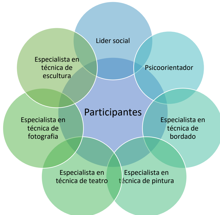
Figura 3. Organigrama

ARMARTE: El arte como arma para la prevención de la violencia de género, es un programa de intervención social diseñado desde las necesidades detectadas en los adolescentes de una Institución Educativa del municipio de Aquitania en el departamento de Boyacá, Colombia, son ellos el núcleo del proyecto y quienes darán sentido a la ejecución de cada una de las actividades planteadas, sin embargo cada sesión estará acompañada de mínimo un líder social conocedor y apasionado en la temática de interés y la persona psicoorientadora de la institución educativa, ellos serán los encargados de direccionar, enseñar y evaluar cada esfera. Por otra parte, están los seis diferentes especialistas en cada técnica artística elegida: bordado, fotografía, dibujo, pintura, escultura y teatro, quienes deben tener experiencia en educación y gestión de proyectos sociales y serán los encargados de la parte práctica de cada sesión.