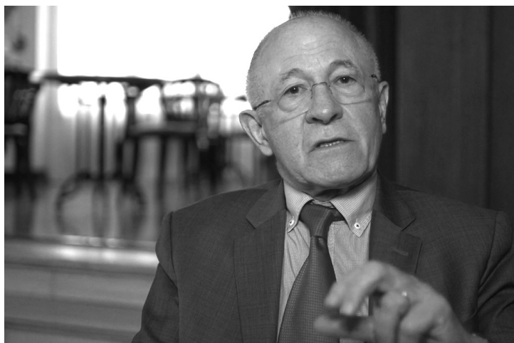
Rémi Brague, en Madrid, durante la entrevista.