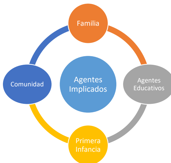
Figura 3. Agentes Implicados