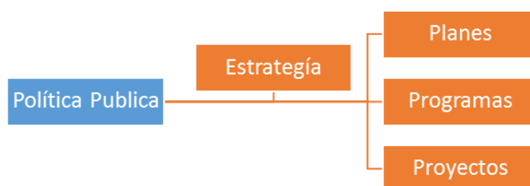
Figura 2. Planes, programas y proyectos

Con el fin ampliar la contextualización para el análisis de los programas, es pertinente ubicar tres elementos que se encuentran al interior de las políticas públicas, y son la materialización de esos fines, a partir de la generación de planes programas y proyectos. Frente a ello es necesario primero definir el concepto de política pública desde la consideración de Roth (2012), quien indica que uno de los propósitos de las políticas públicas, es generar cambios sociales a nivel individual y colectivo. Esto se logra a partir de la identificación de una problemática, necesidad o situación insatisfactoria, y a partir de ello se genera un conjunto de objetivos que son llevados a acciones, de esta forma son tratados de manera completa o parcial, ya sea por línea directa del Estado o por medio de una institución u organización gubernamental. A continuación, se presenta en la Figura 3, el esquema para la formulación de proyectos: