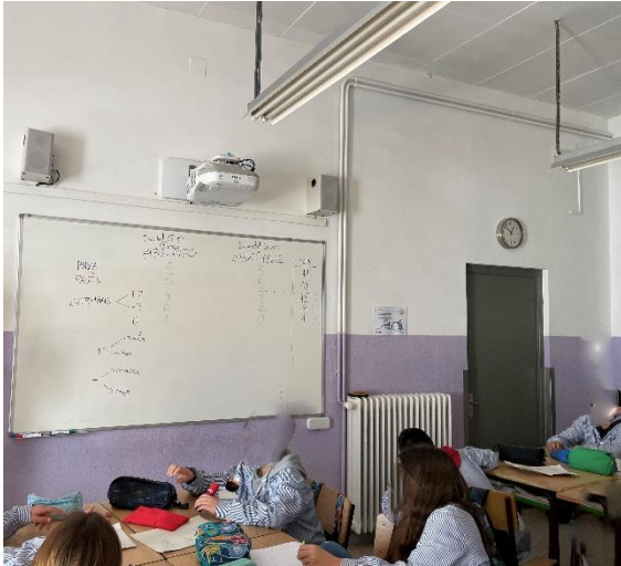
Imagen 9: Puesta en común grupalmente de la información obtenida a través de los cuestionarios