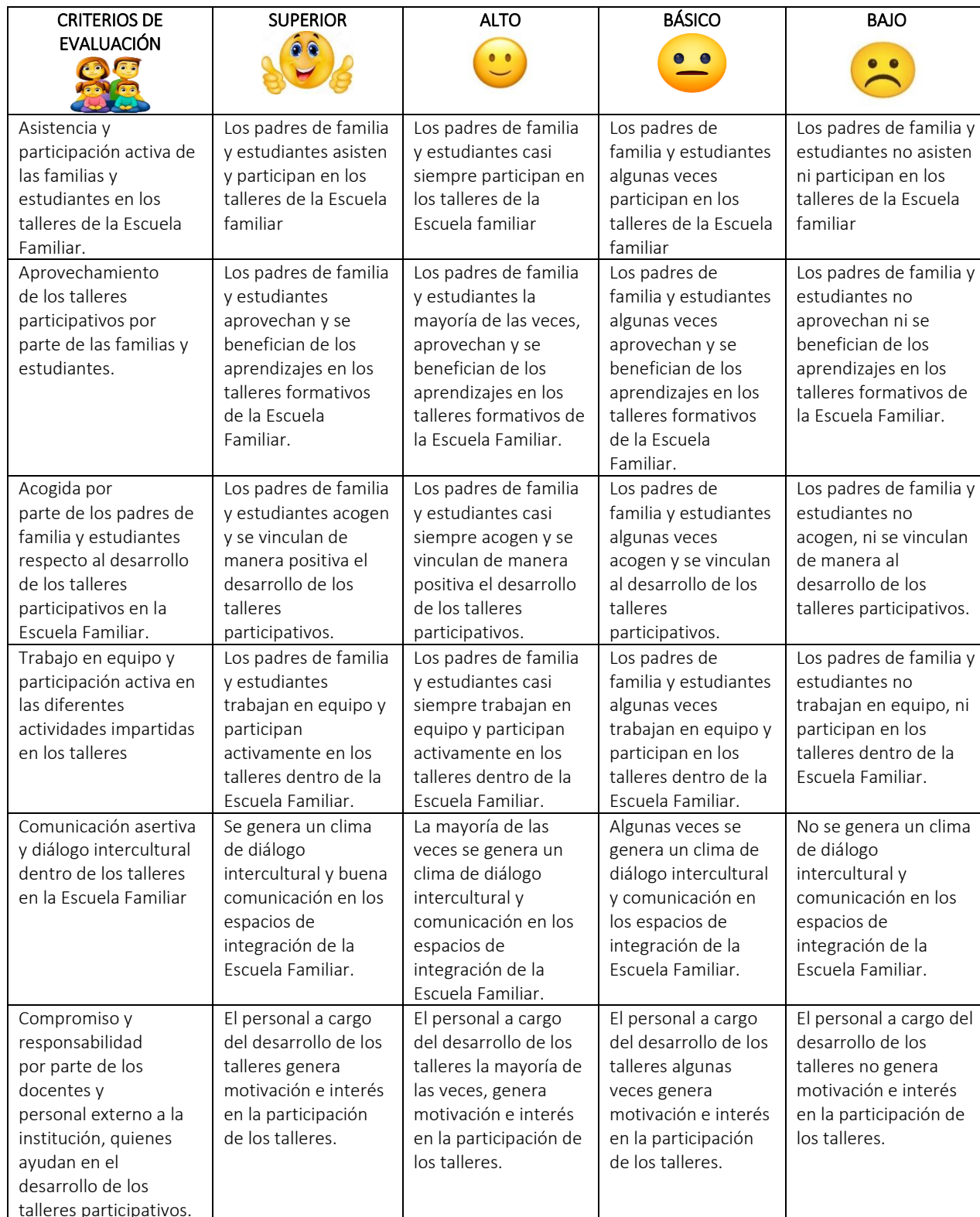
Tabla 15. Rúbrica de evaluación.

analizar y determinar detalladamente los resultados obtenidos en términos de alcance de objetivos, calidad de recursos, dinámica de los talleres, preparación del personal a cargo, dinámica en las actividades e impacto en la comunidad educativa.