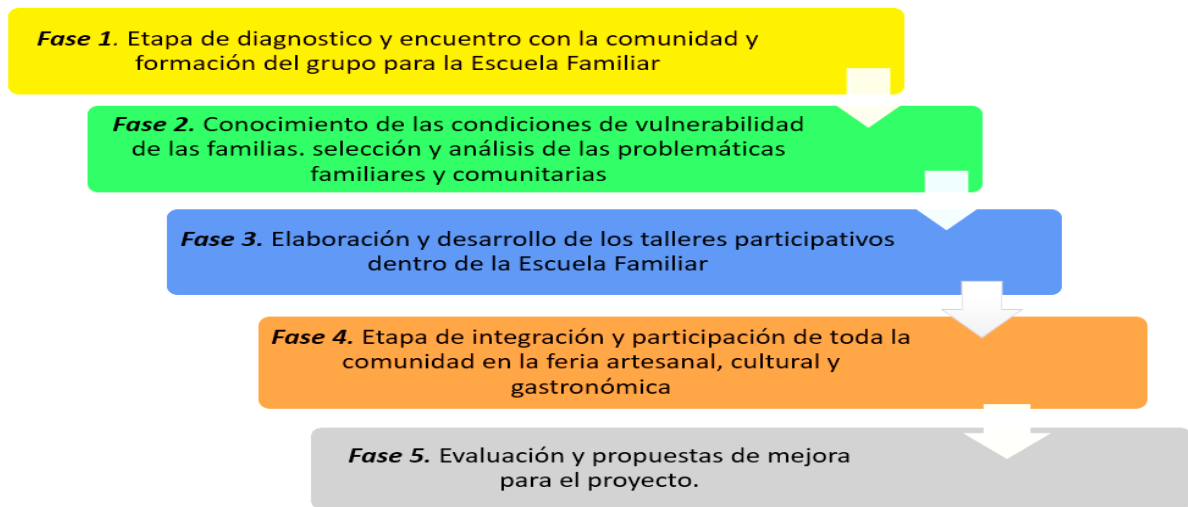
Figura 3. Fases del proceso de la investigación acción participativa (IAP) para la implementación de la Escuela Familiar