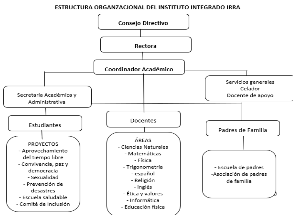
Figura 2. Estructura Organizacional del Instituto Integrado Irra

Un adelanto que merece ser resaltado es que en los últimos meses y con base en el análisis de las necesidades detectadas en el estudiantado, se conformó el Comité de Inclusión, constituido por dos docentes Magister en Educación Inclusiva e Intercultural, la docente psicorientadora, la profesional de apoyo y una estudiante actual de Maestría en Educación Inclusiva e Intercultural. Todas las integrantes en mención laboran dentro de la institución y cooperan para el logro de los apropiados procesos inclusivos de los estudiantes que requieren apoyo y acompañamiento en su proceso académico e integral.