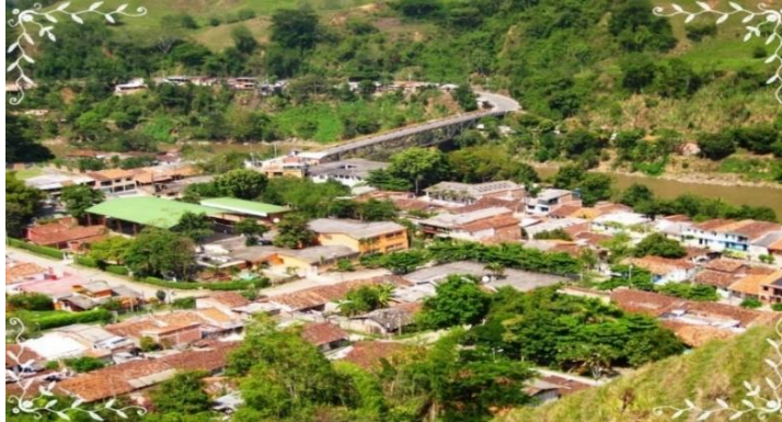
Figura 1. Vista panorámica del corregimiento de Irra