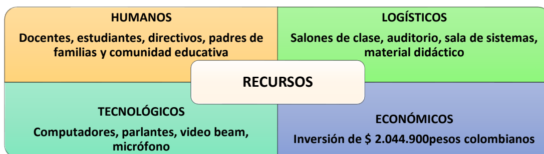
Tabla 2. Recursos para la implementación del proyecto

Igualmente, se cuenta con video proyector, parlantes, computadores, ventiladores, escritorios, silletería, micrófonos, impresora y tableros para el desarrollo de los talleres. Se dispone del material didáctico y otros recursos como fotocopias, todo el material de papelería, refrigerios, entre otros requerimientos necesarios.