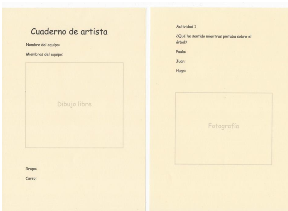
Figura 1. “Cuaderno de artista”