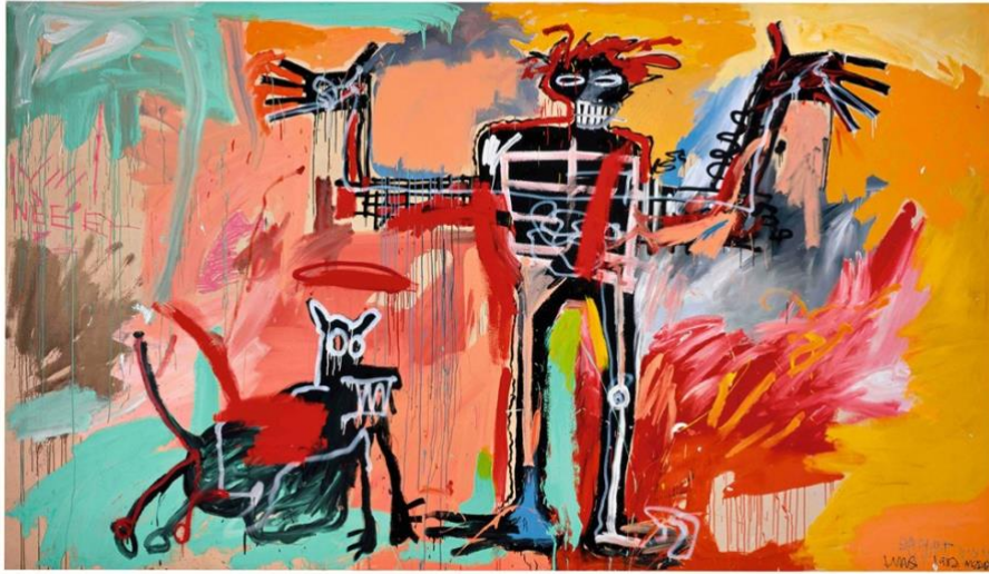
Imagen 6. Jean Michel Basquiat- Arrastre

Fuente: Basquiat, J.M. (1982). Boy and Dog in a Johnnypump . (Pintura). https://i2.wp.com/robbreport.mx/wp-content/uploads/2020/06/basquiat-art.jpg?fit=1024%2C631&ssl=1