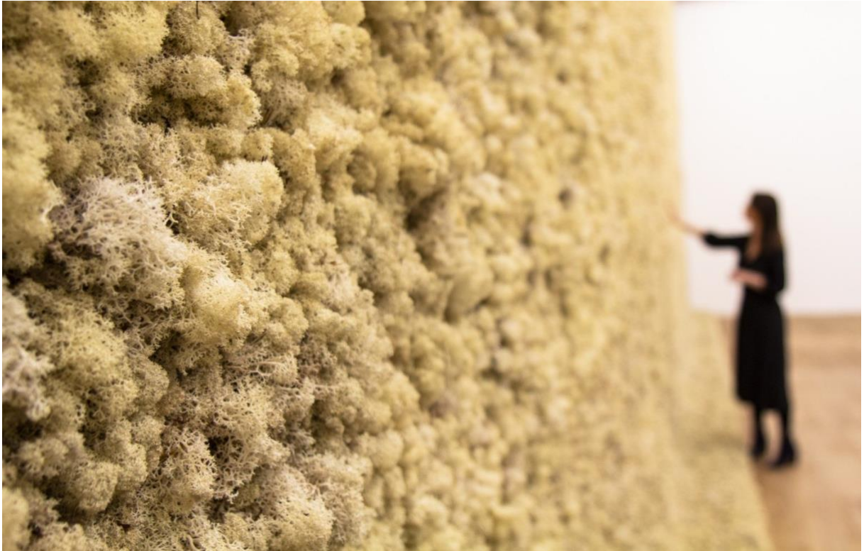
Imagen 2. Pared de Liquen

Fuente: Eliasson, O. (1994). Pared de Liquen. (Instalación). https://arteterapiaec.files.wordpress.com/2019/10/moss-wall_0.jpg?w=1400