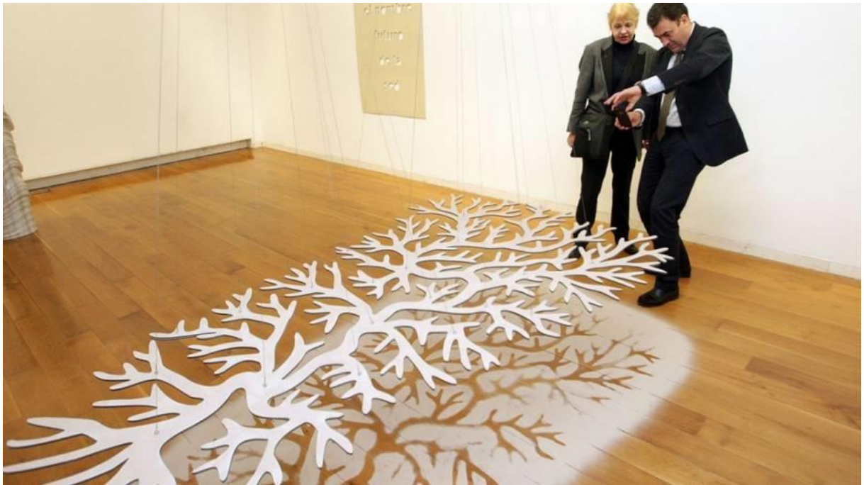
Imagen 4. Hidrotopías

Fuente: Loots, E. (1940). Hidrotopías. (Instalación).