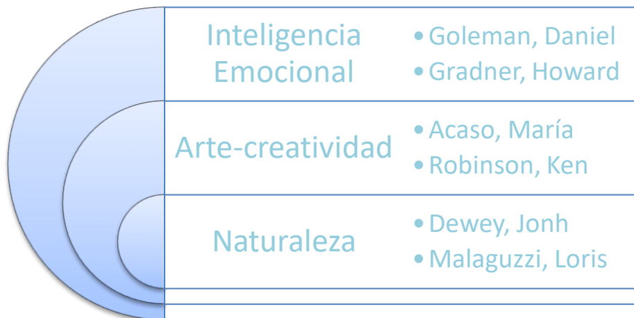
Smart Art 1: Autores destacados

El método de búsqueda y selección de la bibliografía ha sido llevado a cabo, identificando en primer lugar los autores destacados que se exponen a continuación, por ser estos los más representativos y acordes a las teorías y principios que se recogen y en los que se fundamenta este proyecto didáctico.