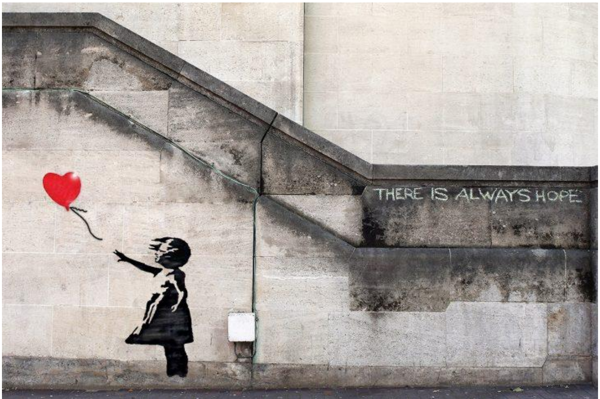
Imagen 7. Banksy- Dripping

Fuente: Banksy. (2013). There is always hope . (Mural). https://3minutosdearte.com/wp-content/uploads/2019/03/Stencil-e1553805187260.jpg