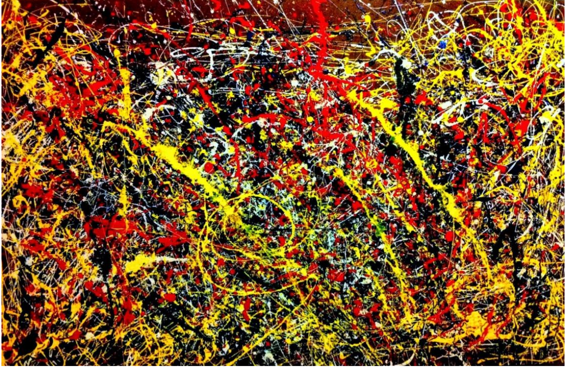
Imagen 5. Pollock-Dripping

Fuente: Pollock, J. (1985). Impresión en lienzo. (Pintura).