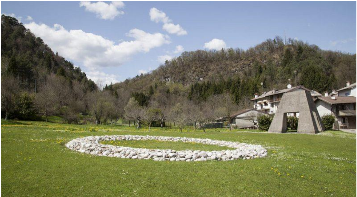
Imagen 3. Art Park

Fuente: Long, R. (1996). Art Park . (Intervención). https://www.studionord.news/wp-content/uploads/2018/06/RICHARD-LONG_Tagliamento-River-Stone-Ring-1996-Art-Park-Collezione-Egidio-Marzona-Verzegnis_Ph.-%C2%A9-Eva-Basso_5-1024x683.jpg