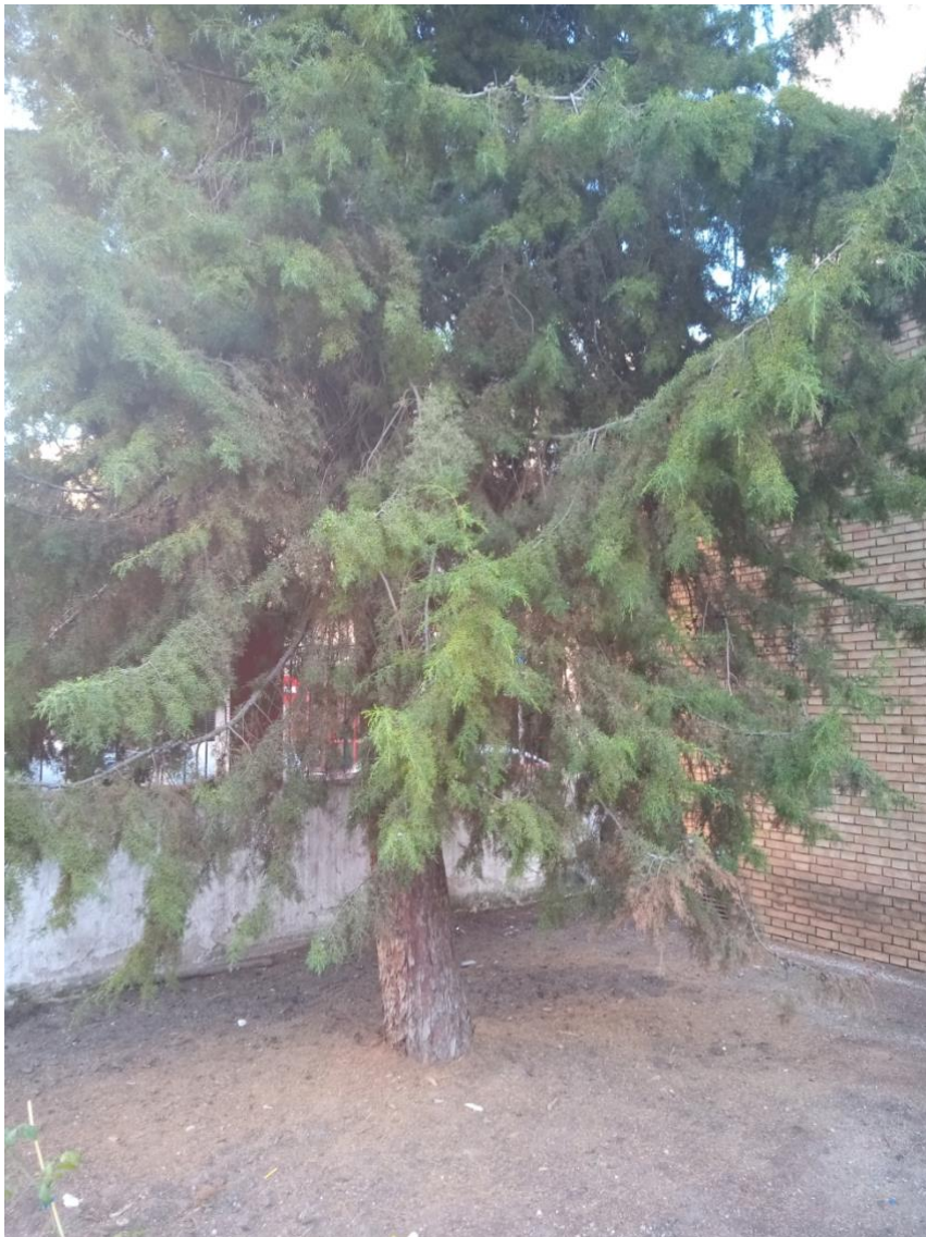
Imagen 9. Actividad 1. Patio árbol