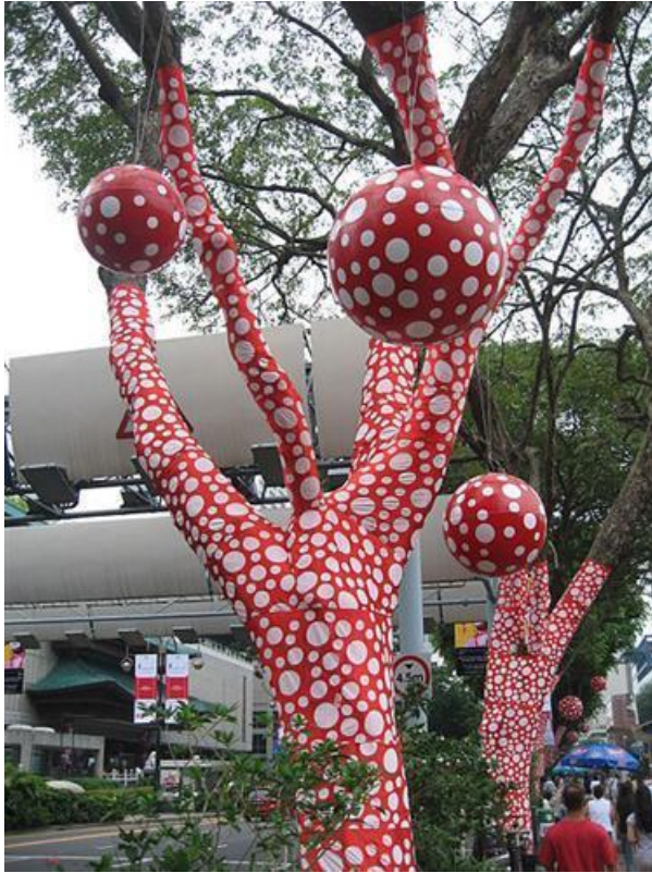
Imagen 1. Ascension of Polkadots on the trees

Fuente: Kusama, Y. (2006). Ascension of Polkadots on the Trees . (Instalación).