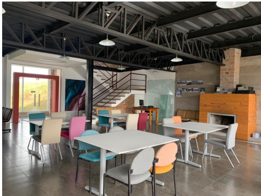
Anexo A6. Vista frontal de comedor, Refugio Yanacocha GA-CSG.