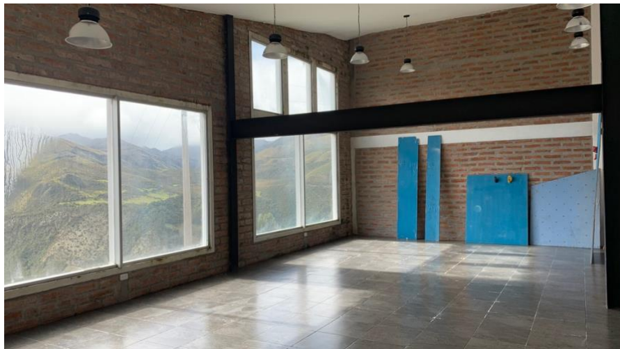
Anexo A11. Área de taller 1, Refugio Yanacocha GA-CSG.