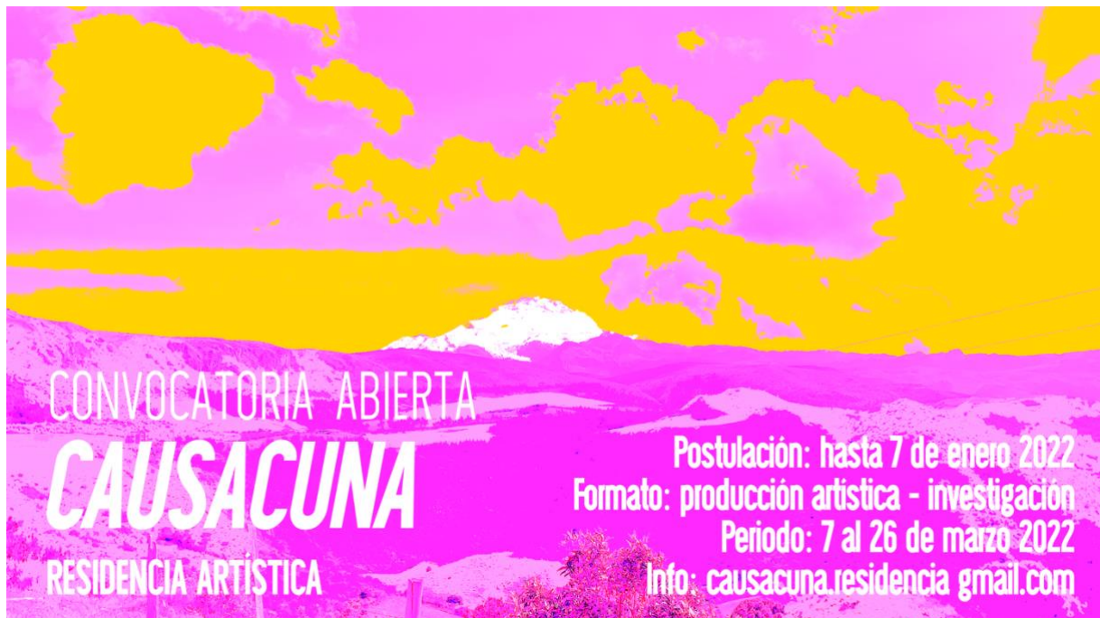
Anexo C1. Boceto de imagen de convocatoria, Residencia Artística Causacuna.