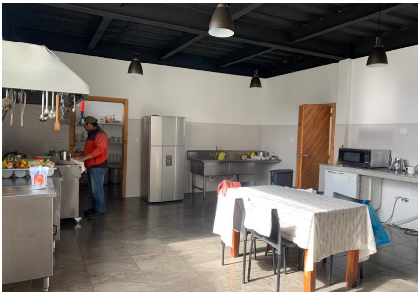
Anexo A4. Cocina, Refugio Yanacocha GA-CSG.