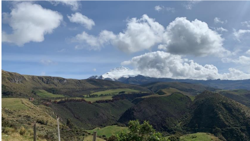
Anexo A3. Vista del nevado Cayambe desde el Refugio Yanacocha GA-CSG.