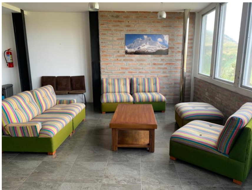
Anexo A8. Sala de esta segundo pisor, Refugio Yanacocha GA-CSG.