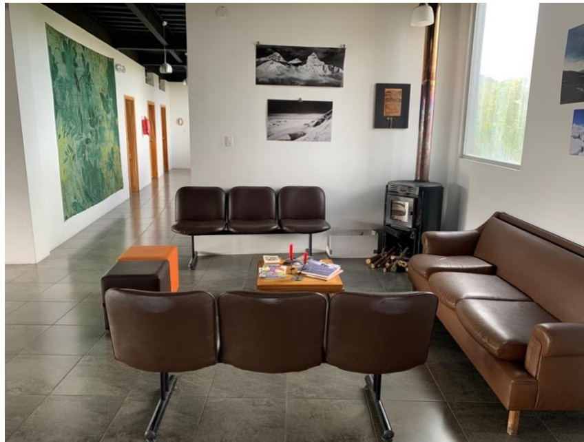
Anexo A7. Sala de estar, Refugio Yanacocha GA-CSG.