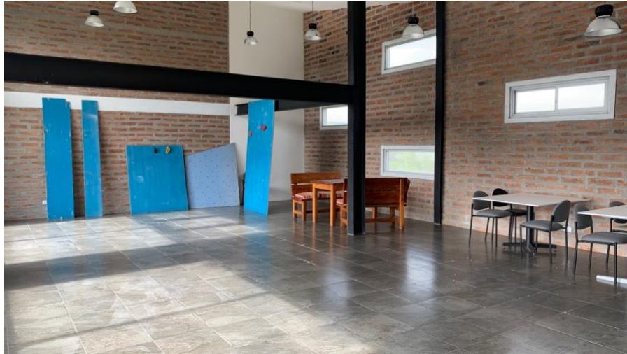
Anexo A12. Área de taller 2, Refugio Yanacocha GA-CSG.