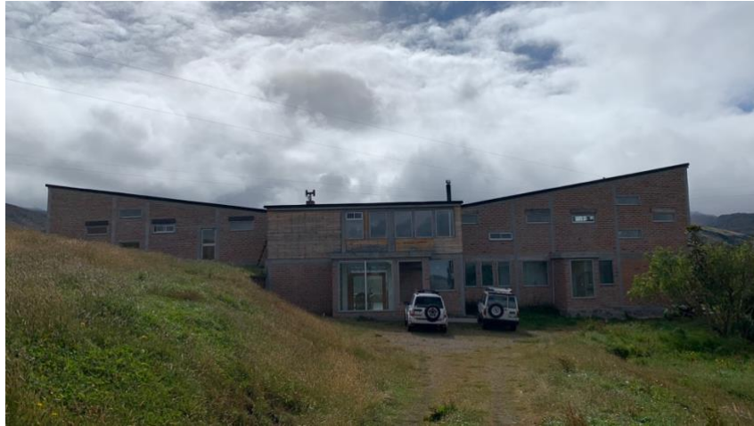
Anexo A1. Fachada 1, Refugio Yanacocha GA-CSG.