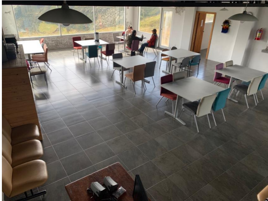
Anexo A5. Vista superior de comedor, Refugio Yanacocha GA-CSG.