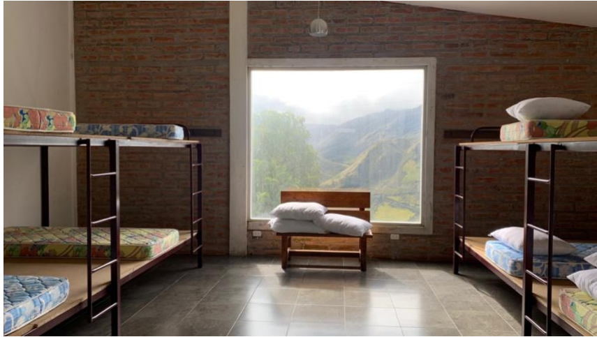
Anexo A9. Dormitorios compartidos 1, Refugio Yanacocha GA-CSG.