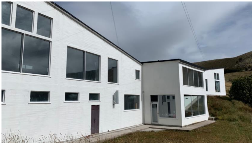
Anexo A2. Fachada 2, Refugio Yanacocha GA-CSG.