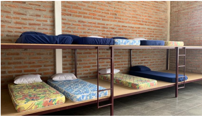
Anexo A10. Dormitorios compartidos 2, Refugio Yanacocha GA-CSG.