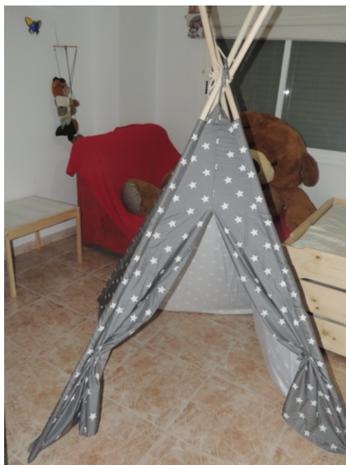
Figura 6. Sala multiusos.