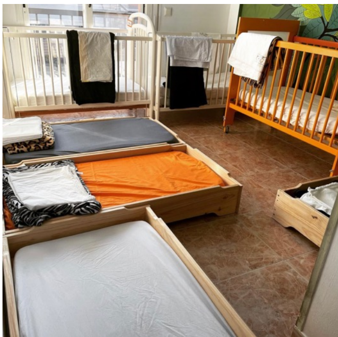
Figura 7. Zona de descanso.