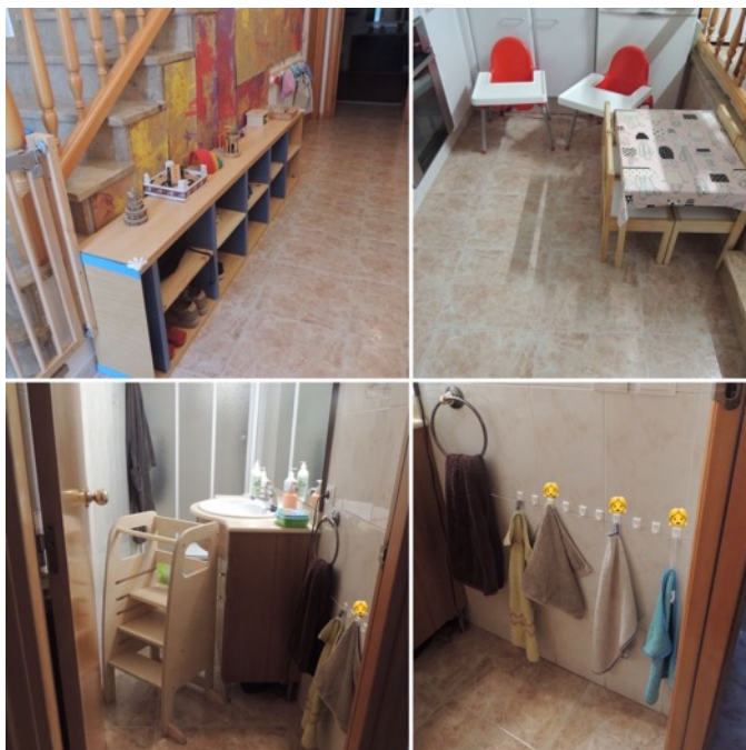
Figura 1. Entrada, cocina y lavabo.