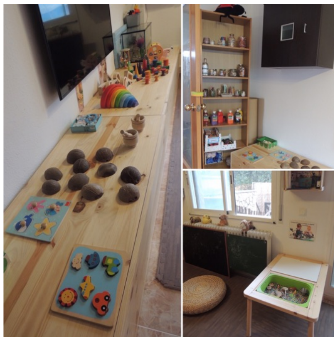
Figura 3. Comedor (espacio de juego).