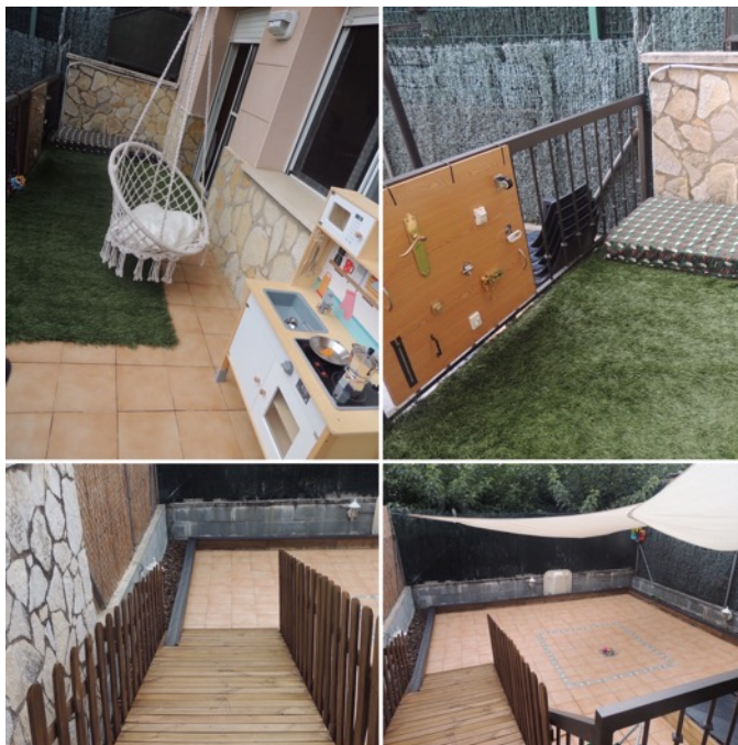
Figura 5. Terraza.