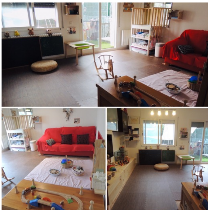
Figura 2. Comedor (espacio de juego).