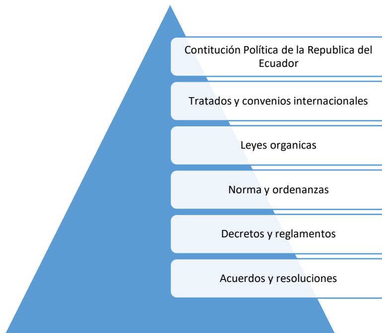
Figura 1 Orden jerárquico de aplicación de normas y leyes