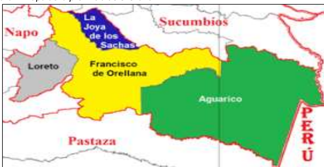
Figura 2 Mapa de la provincia de Orellana

La Dirección Distrital 22D02 Loreto Orellana (M.I.E.S) desarrolla sus actividades en la provincia de Orellana constituida por cuatro cantones: Francisco de Orellana, Joya de los Sachas, Loreto y Aguarico, para la ejecución de las actividades se tiene un presupuesto público establecido por el estado ecuatoriano para el cumplimiento de la política pública de atención a la primera infancia.