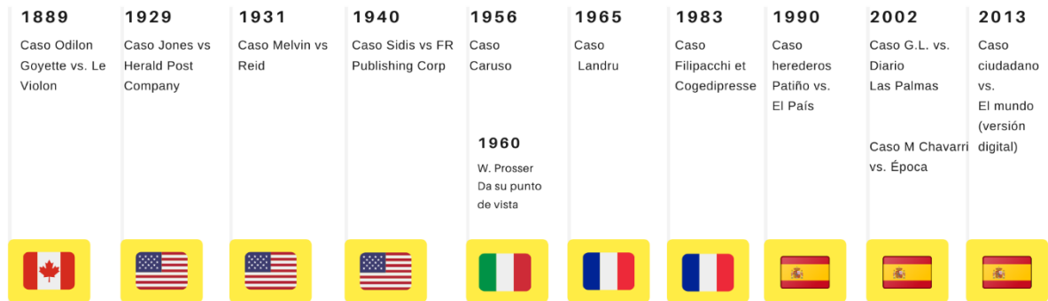
Figura 3. "Evolución jurisprudencial del derecho al olvido, previo a su reconocimiento en 2014". Estudio de casos más relevantes. (Elaboración Propia)