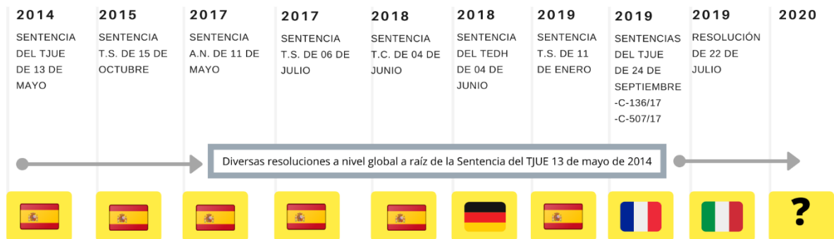
Figura 4. "Evolución jurisprudencial del derecho al olvido, tras su reconocimiento hasta la actualidad". Tras la pionera sentencia, ha habido en paralelo diversas resoluciones en todo el mundo. (Elaboración Propia)