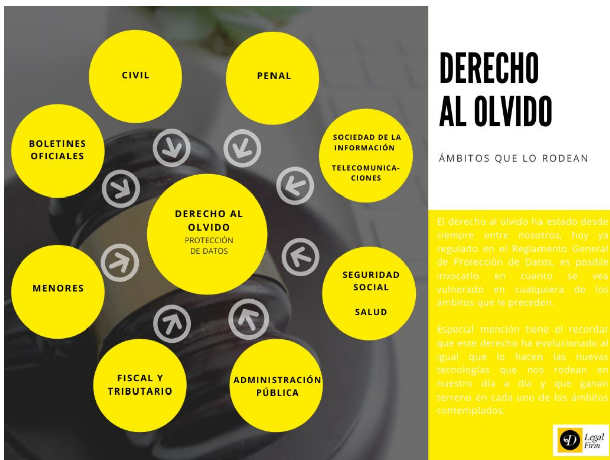
Figura 5. “Ámbitos que rodean al Derecho al olvido”. (Elaboración Propia)