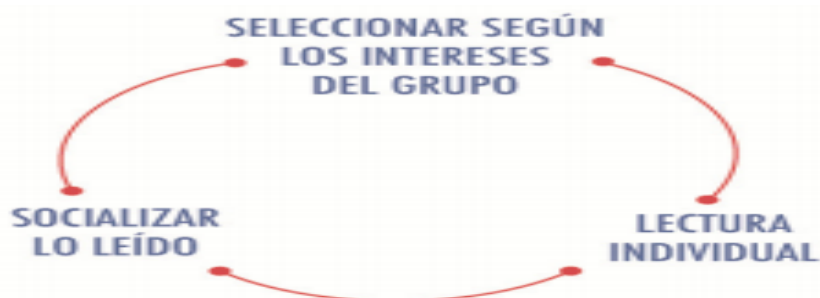
Figura 2. Para seleccionar una lectura. (Aguayo, M. y Casali, C., 2016, p. 1)

Una de las claves para conseguir que los alumnos se puedan enriquecer con los beneficios de la lectura que se han señalado anteriormente y que, además, contribuirá a que estos lleguen a disfrutar leyendo, es la selección de las obras más adecuadas para ellos, tal y como expone en su libro Llach (2010). Este es un trabajo que se debe realizar de forma correcta por parte de los docentes y que no se puede relegar a las recomendaciones de otros docentes, editoriales o guías de lectura que podamos encontrar. A la hora de seleccionar una obra literaria para la lectura de nuestros alumnos nos podremos ayudar de todas estas medios que se encuentran a nuestro alcance (recomendaciones de personas con experiencia, catálogos de las editoriales, libros más vendidos, reseñas y críticas de revistas o prensa especializada, etc.), pero, debemos cerciorarnos nosotros mismos de que verdaderamente son obras adecuadas para los alumnos a los que irán dirigidas y que cumplen los requisitos que otros dicen que tienen.