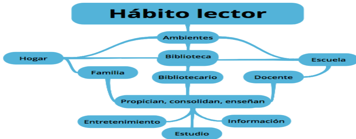
Figura 3. Hábito lector y ambientes en los que desarrollarlo (Inspirado en Galindo (s.f.). Elaboración propia)

Sabiendo qué es el hábito lector y que, aunque se crea a partir de una decisión particular del sujeto, en su consolidación intervienen factores externos que motivan su creación o la desmotivan, podemos señalar, como importantes, en el proceso de creación de este hábito, la familia, la escuela y la biblioteca, tres realidades muy cercanas a los niños, su entorno social más próximo y que podría ser el resumen de aquellos factores externos a los que nos hemos referido anteriormente y que podrían suponer la base de sus motivaciones o desmotivaciones (Cerrillo, Larrañaga y Yubero, 2002).