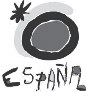
Figura 4. Logo de la marca turística española: El Sol de Miró

de marketing españolas, principalmente porque inició su recorrido en los años 80 y actualmente sigue en puestos líderes de imagen de marca. El logo de Miró está presente en todos los elementos de comunicación desarrollados por TURESPAÑA y se ha convertido en seña de identidad del turismo español.