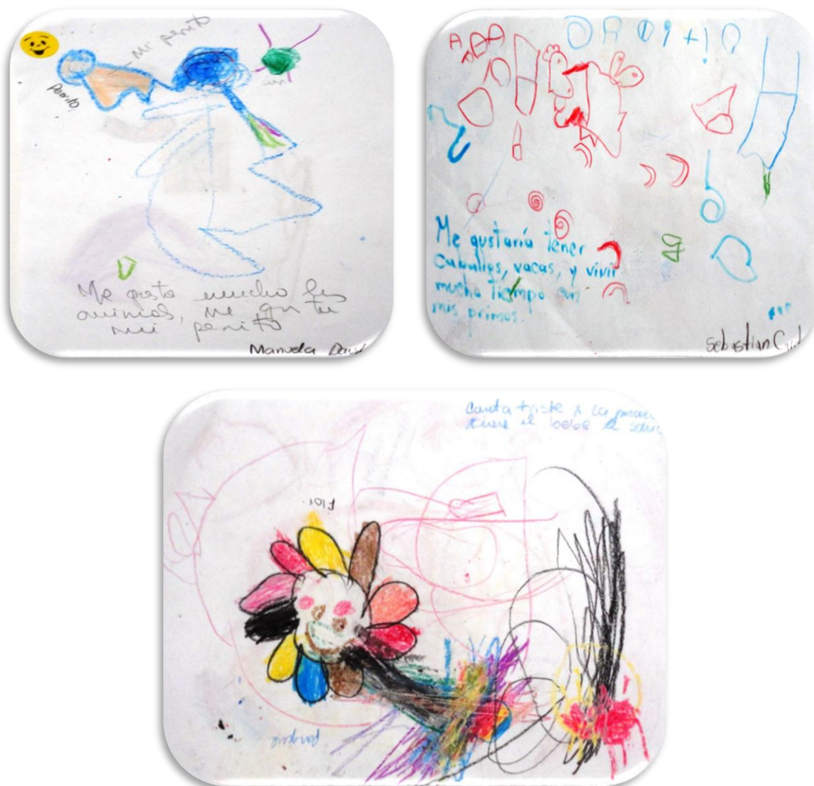
Imagen 3. Representación de mascota, relación con el medio ambiente