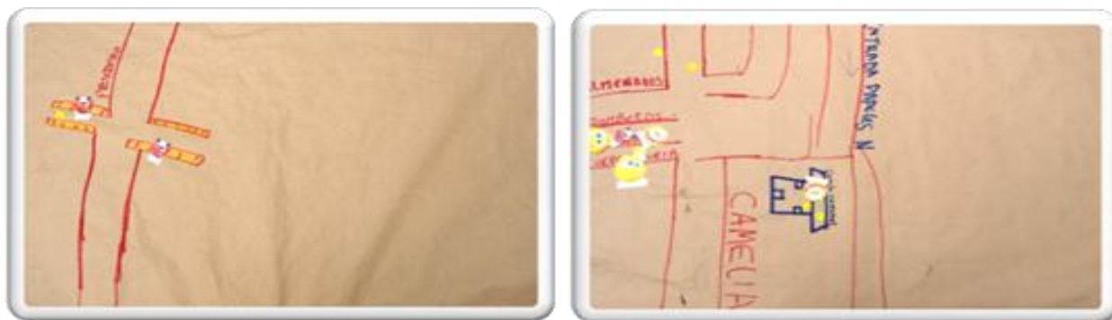
Imagen 6. Sector del Progreso y Bomberos

Según las familias participantes en el ejercicio, los espacios de riesgo están configurados por la carencia de seguridad, las situaciones de violencia, la presencia de grupos al margen de la ley y demás factores de vulnerabilidad mencionados inicialmente.