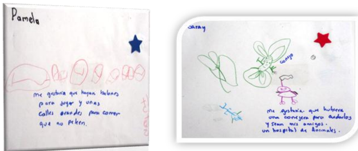
Imagen 7. Visualización de Fututo