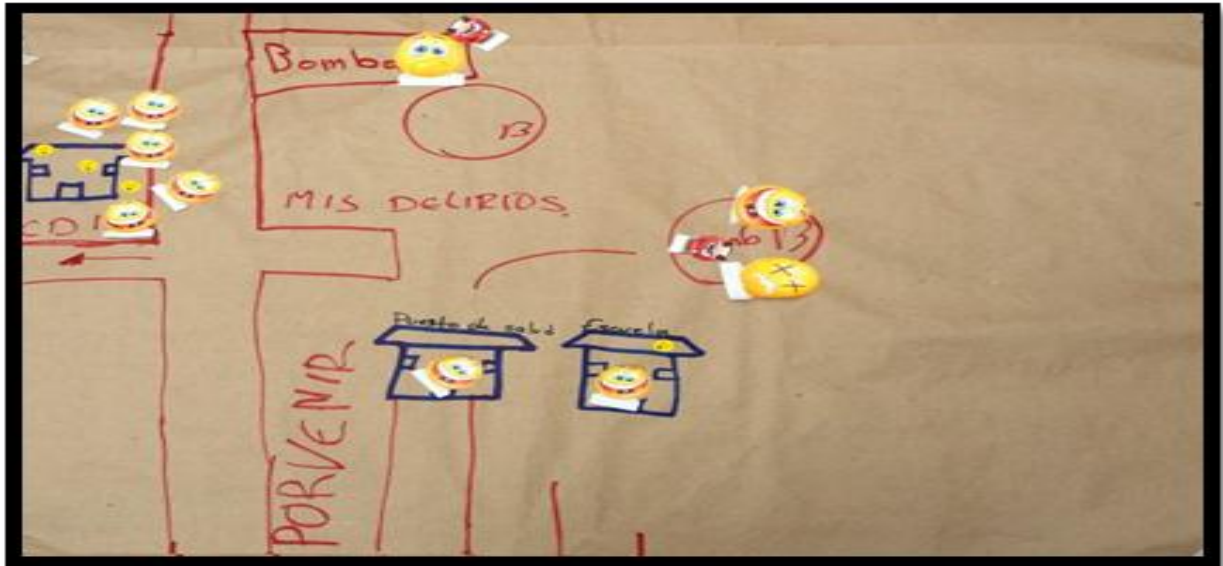
Imagen 4. CDI como espacio protector