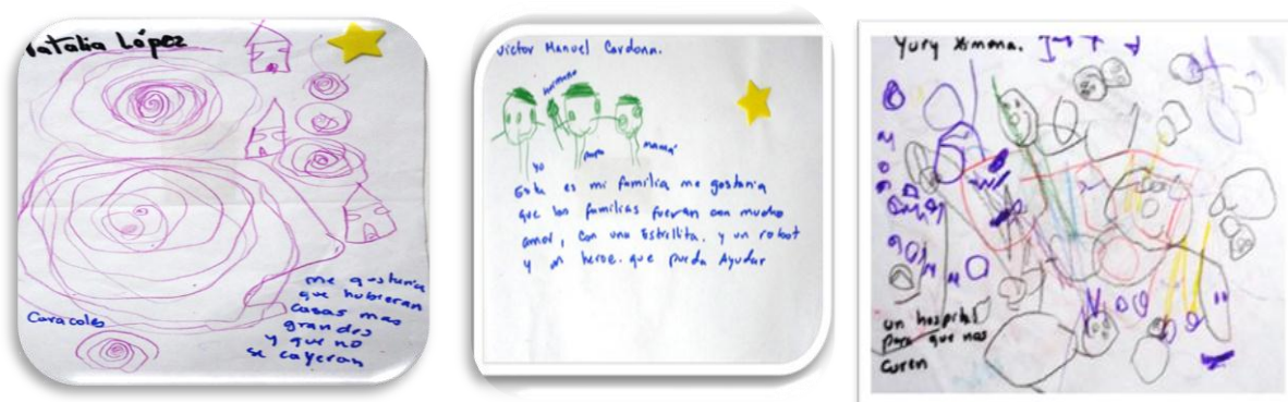
Imagen 8. Visualización de futuro

Además refieren el derecho a la salud evidenciado en: “Un hospital para que nos curen, unas matas de bananas.