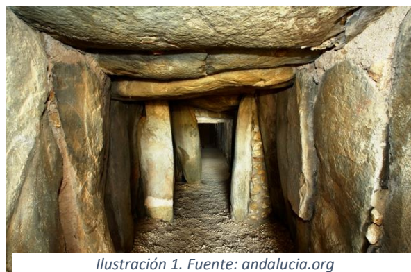
Ilustración 1.

La primera de las actividades consiste en la visita al Dolmen de Soto, yacimiento situado a escasos metros del término municipal de Almonte. Debido a que tiene un gran valor cultural, ayudará a afianzar los conocimientos que anteriormente hemos adquirido en el aula y favorecer el aprendizaje significativo. El Dolmen se caracteriza por ser un monumento con carácter funerario, datado entre el 3000-2500 a.C. y es uno de los claros ejemplos de la arquitectura del Neolítico. Catalogado como uno de los