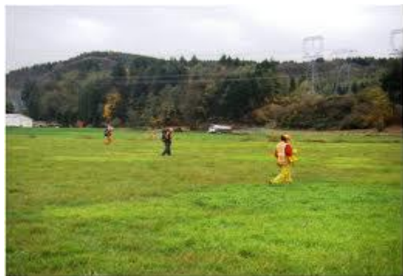
Ilustración 2. Prospección.

Esta es una actividad que se realiza para el estudio de un terreno susceptible de ser potencialmente arqueológico y por ende haber un yacimiento. Es muy sencilla, pues simplemente se trata de caminar sobre el terreno en el que se piense que puede existir restos arqueológicos. Por lo general se lleva a cabo en zonas amplias y se realiza en equipo, camina en línea recta y de forma pausada hacia adelante y apuntando la mirada hacia el suelo observando objetos o restos de piedras que puedan pertenecer a objetos y útiles.