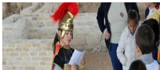
Ilustración 6. Alumnos interpretando.

Esta última actividad tiene la función de actuar como colofón de todas las actividades propuestas en la unidad didáctica; pasando por La prehistoria, Las Primeras Civilizaciones y la Cultura Clásica. Por ello, se pretende que refuercen los contenidos mediante una actividad dinámica y divertida, pues con la ayuda de la imaginación y mediante disfraces y ropajes los conocimientos adquiridos de las culturas estudiadas, así como los diferentes roles que existían en las diferentes sociedades históricas. El alumnado llega a conocer y a diferenciar el papel de un pretor, un esclavo, soldado o senador romano y sus diferentes funciones.