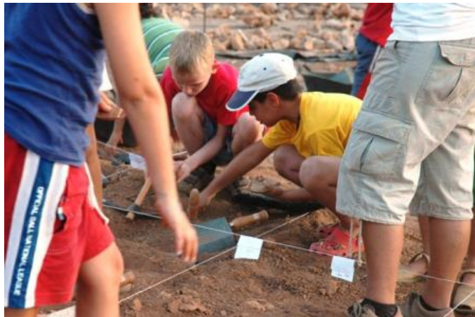
Ilustración 3. Excavación Arqueológica.

Se realizará una fosa de unos 8,5 m 2 en el patio del instituto, un área que está compuesta por gravilla y mezcla de arcilla y arboles dispersos. La elección de la zona debe ser viable para poder realizar la actividad en años posteriores, por ello es necesario elegir un lugar en el que no puedan existir obstáculos y haya impedimento o entorpecimiento de espacio que requiera el alumno. La preparación de la cuadrícula se va realizar mecánicamente, alcanzando una profundidad de unos 30 cm. Se van a introducir de manera arbitraria huesos y útiles líticos varios con el fin de representar un enterramiento lo más próximo posible a la realidad, haciendo que la cercanía del objeto y la posibilidad de ser analizados, medidos, tocados, pesados, y posibilita un aprendizaje más significativo, por lo que no será necesario la imaginación para visualizar lo que hemos comentado en clase, sino que todos podrán aprender perfectamente qué son los útiles líticos y herramientas más frecuentes del paleolítico.