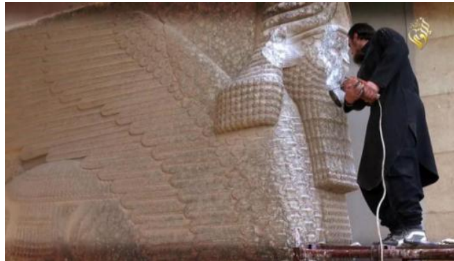
Ilustración 4. Destrucción Patrimonio.

El Patrimonio tiene un importante valor educativo, pues puede ayudar a potenciar y desarrollar procedimientos como la representación y la interpretación del espacio. La didáctica del patrimonio debe ser parte del proceso reglado de enseñanza-aprendizaje debido a que formará al ciudadano en este campo. Esta actividad se orienta al desarrollo de valores cívicos éticos y afectivos haciendo referencia a la defensa y protección del Patrimonio, así como el conocimiento de costumbres y tradiciones que ayuden a reforzar la identidad cultural del individuo a la vez que fomentar la geo-diversidad, biodiversidad y diversidad.