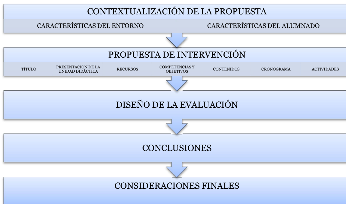
Figura 2: Apartados de la propuesta de intervención

En la figura siguiente, se detallan los distintos apartados que se desarrollarán en la propuesta de intervención elaborada: