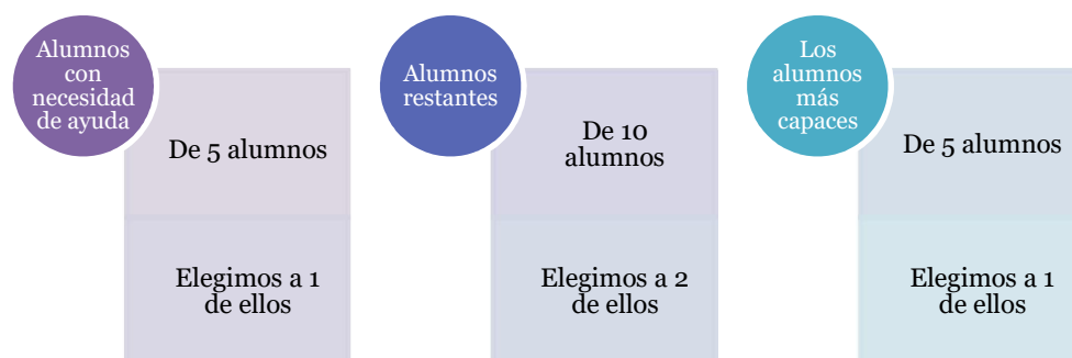
Figura 3: Distribución de los alumnos

Tal y como hemos mencionado anteriormente, teniendo en cuenta las características de cada alumno y siguiendo las bases de Pujolàs (2003,2011) realizaremos 5 grupos formados por 4 alumnos en cada uno de ellos. Partiendo de la distribución como se detalla en la siguiente figura: