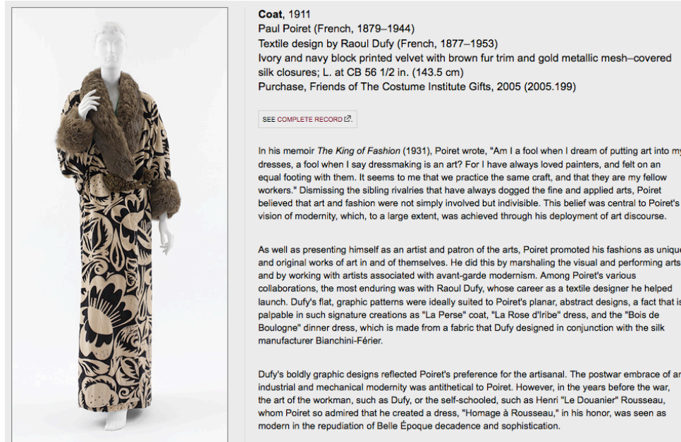
Figura 1. Coat.