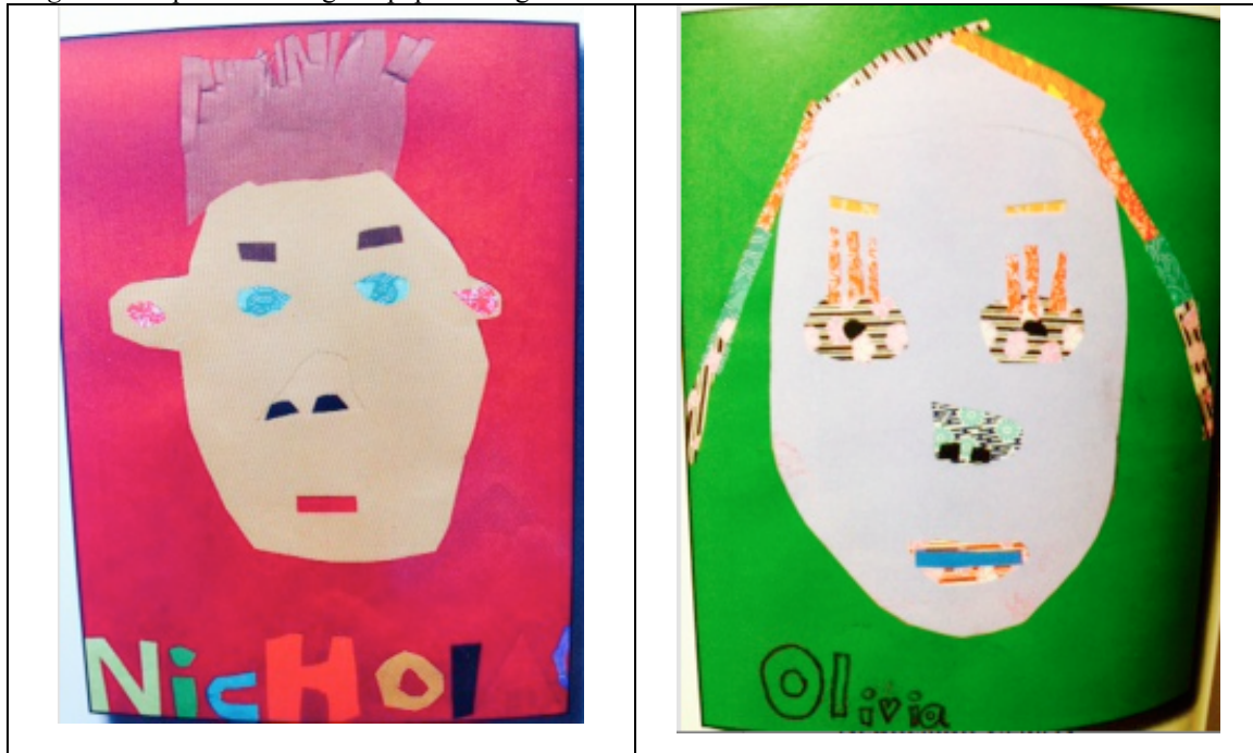
Figura 4. Expressions-origami paper collage.