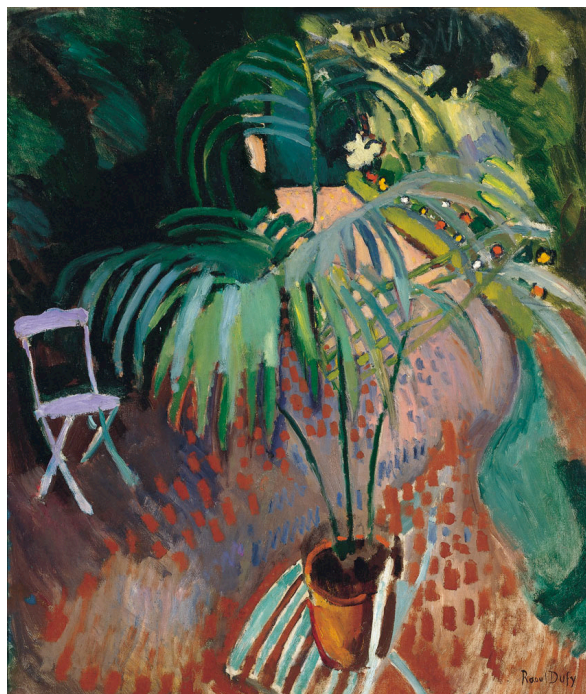
Figura 2. La pequeña palmera