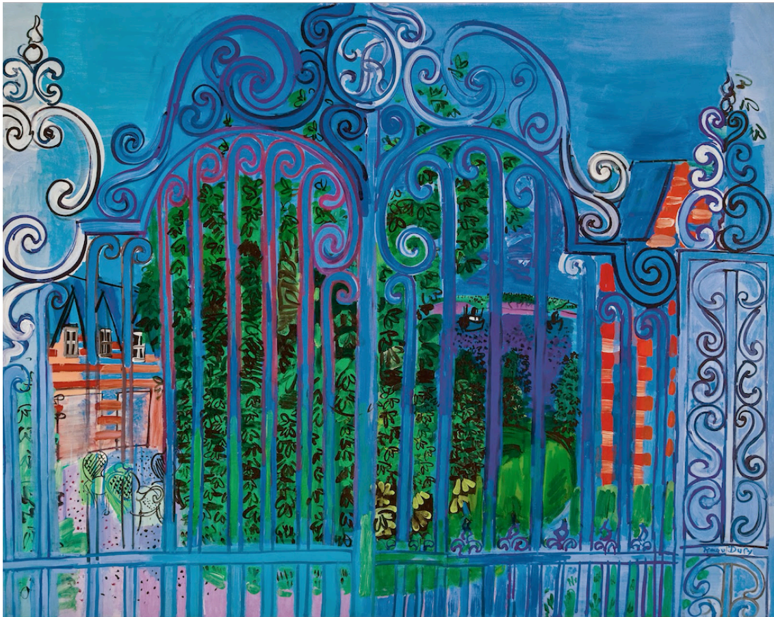
Figura 5. La reja.