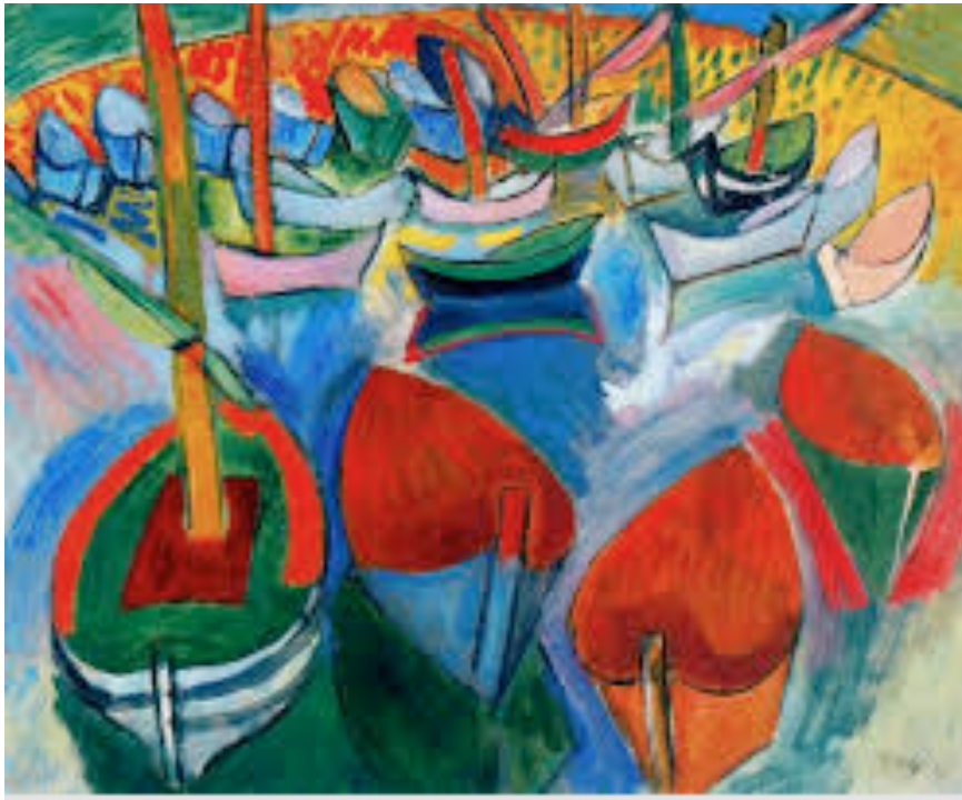
Figura 6. Barcas en Martigues.