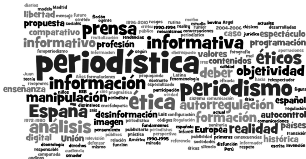
Cuadro 6: Nube de palabras con los títulos de las tesis doctorales

En el Cuadro 6 pueden verse los términos que aparecen en los títulos de las 75 doctorales analizadas, su mayor o menor tamaño en la imagen está directamente relacionado con su frecuencia de aparición. Se trata de una nube de palabras que ha sido generada con el programa Wordle ®.