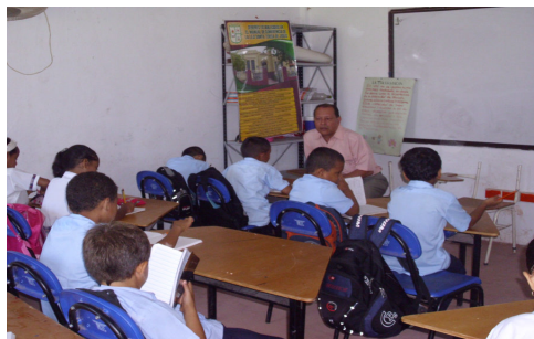
Grafico 3: Niños previamente diagnosticados (muestra) con Dislexia visoespacial

MUESTRA: La muestra estuvo compuesta por 9 niños con edades comprendidas entre siete y nueve años, de ambos sexos y coeficiente intelectual propio a sus edades, esta muestra estuvo previamente diagnosticada por el colegio. (grafico 3)