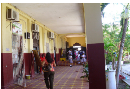
Grafico 2: Instalaciones de la Institución Educativa Santa Teresa de Jesús, de donde se tomó la población para la presente investigación.

DELIMITACION DE LA POBLACIÓN: La población seleccionada estuvo constituida por 45 estudiantes de la Institución Educativa Santa Teresa de Jesús, de carácter estatal, ubicada en el municipio El Banco, departamento del Magdalena; Republica de Colombia, de estratos 1 y 2, de los grados 1 o , 2 o y 3 o de primaria. (grafico: 2)