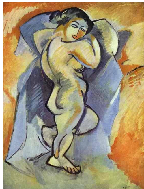
Ilustración 4: Desnudo grande. Braques.