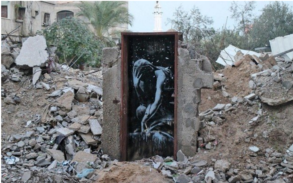
Ilustración 11: Thinker. Banksy.