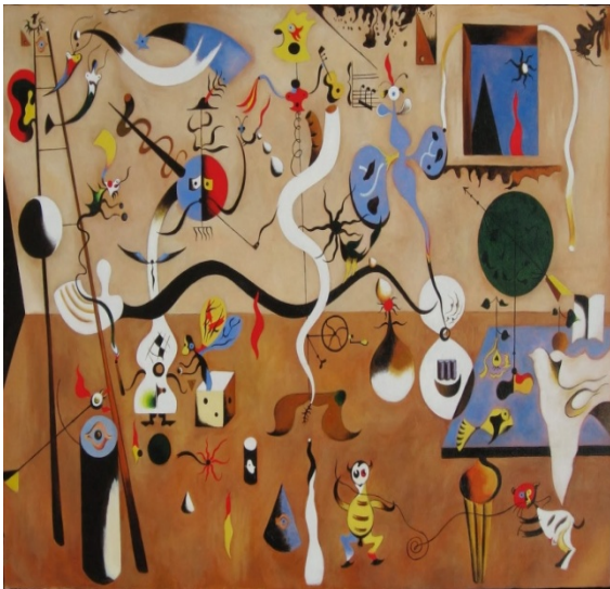
Ilustración 5: Carnaval de Arlequín. Miró.