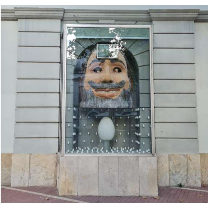
Ilustración 14: Cabeza Gigante, Dalí.