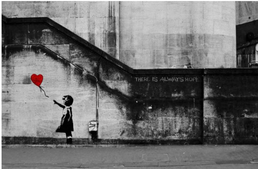
Ilustración10: Girl with balloon. Banksy.