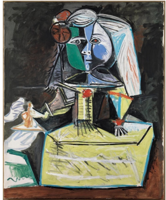
Ilustración 2: Las Meninas [infanta Margarita María]. Picasso.