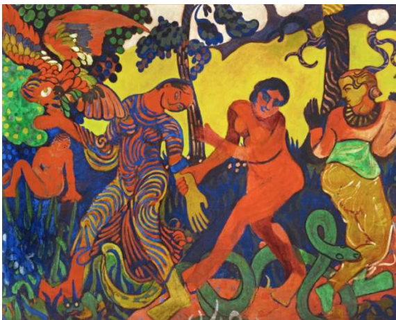
Ilustración 3: La danse. Derain.