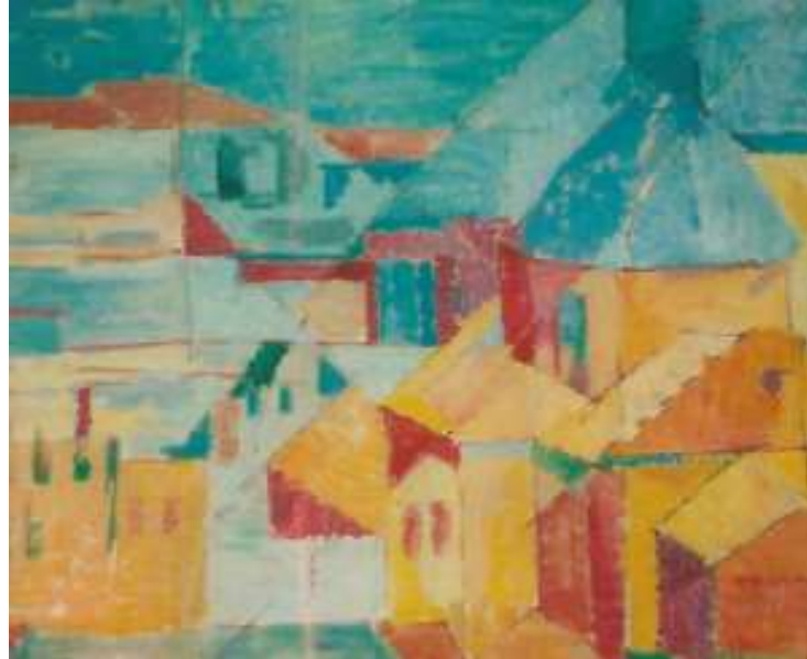
Ilustración 12: Desde mi ventana, Gómez-Morán