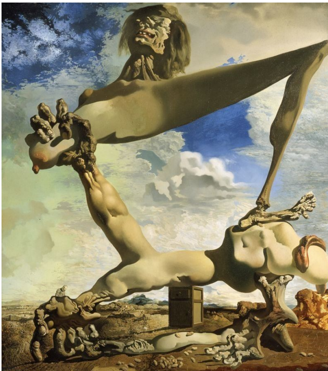
Ilustración 11: Construcción blanda con judías hervidas. Dalí