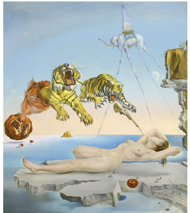
Ilustración 6: Sueño causado por el vuelo de una abeja alrededor de una granada un segundo antes del despertar. Dalí.