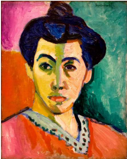
Ilustración 2: La raya verde. Matisse.