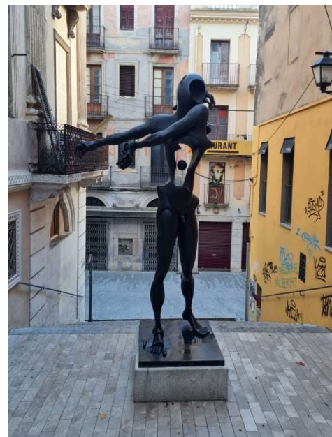
Ilustración 13: Homenaje a Newton, Dalí.