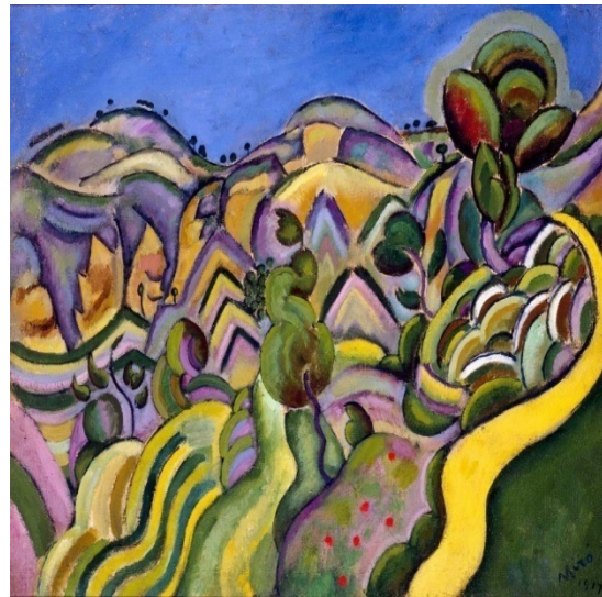
Ilustración 10: Siurana, el camino. Miró