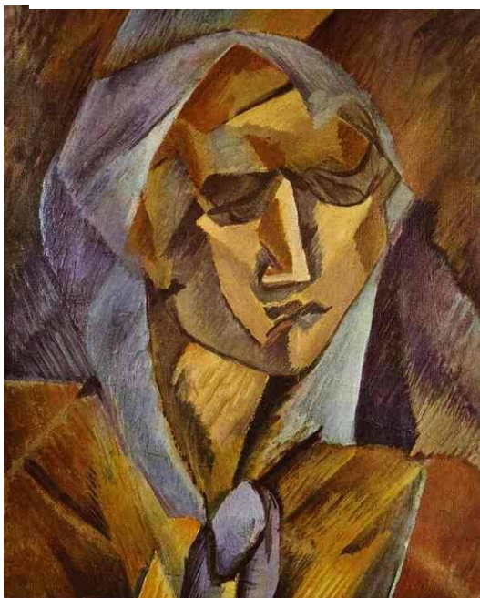
Ilustración 3: Cabeza de mujer. Braques.