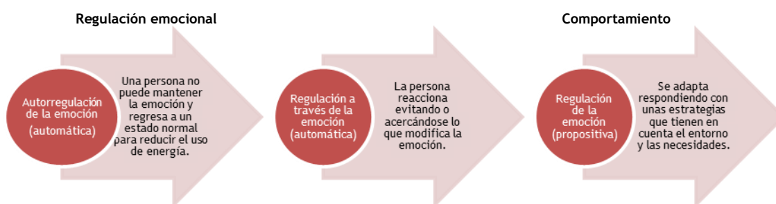
Figura 1. Mecanismos y procesos de regulación emocional.

La regulación emocional es el proceso por el que las personas toman decisiones al respecto de sus emociones, ya sean positivas o negativas, para después modularlas y alcanzar así los objetivos personales y sociales. Con ello, se modifica el comportamiento que le permita adaptarse de manera más eficiente y efectiva al entorno (Gómez y Calleja; 2016; Repetto, 2009). El individuo plantea una estrategia focalizada a cambiar o mantener el estado afectivo en el que se encuentra (Gross y Thompson, 2007). Esta regulación implica un proceso. Lo primero que requiere es de una autorregulación de la propia emoción. Segundo, una regulación a través de la emoción (siendo estas dos primeras fases de tipo automáticas). Finalmente, la fase propositiva es la que constituye la regulación de la emoción (Gómez y Calleja, 2016). La regulación emocional del profesor tiene un impacto positivo en el logro del aprendizaje del estudiante, en la relación de sus emociones con ellos y en su propio cuidado emocional para evitar el burnout de su práctica docente (Martínez, 2019).