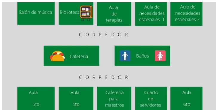
Figura 3. Croquis segunda planta alta

Según el organigrama institucional, la directora toma las decisiones macros en el plantel, después de ella, viene el consejero, quién con especialidad en Manejo de Comportamiento, direcciona las situaciones que se puedan presentar en cuanto a problemas de conducta para los estudiantes del bachillerato especialmente.