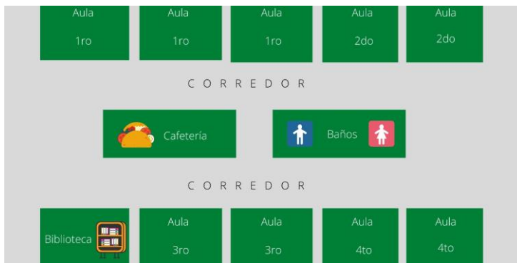
Figura 2. Croquis primera planta alta