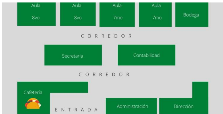
Figura 1. Croquis planta baja

La escuela es de administración privada, tiene alrededor de 21 profesionales de la educación, 5 personas en área administrativa y 5 en el área de la cafetería.